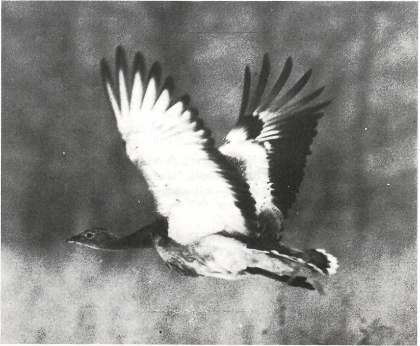
Abb. 1: Fliegende Großtrappe (Henne).

Ihre Standorte kann sich die Art in unserer Kulturlandschaft nicht mehr beliebig aussuchen; 9 mal scheint Wintersaat, 6 mal Klee auf; der Haupttrupp (46 Ex.) im österreichischen Hanság hielt sich noch auf der den ganzen Winter nahrungsspendenden Rapsfläche auf.