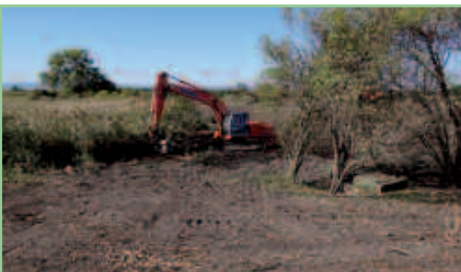
Beginn der Freilegung der Zitzmannsdorfer Quelle, am rechten Bildrand ist die Steineinfassung der Quelle erkennbar.