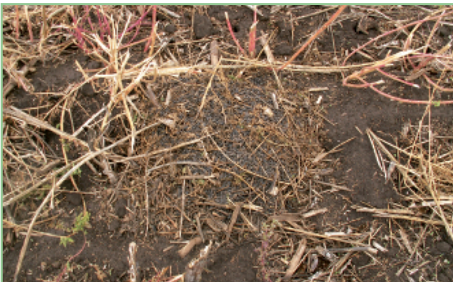
Fertiger Vorratshügel mit Erde bedeckt