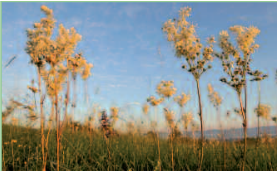
Magerwiese mit Klein-Mädesüß

„Wege zur Förderung und Erhaltung der Artenvielfalt im Grünland.“ Zusammenfassung einer Tagung an der UNI für Bodenkultur in Wien.