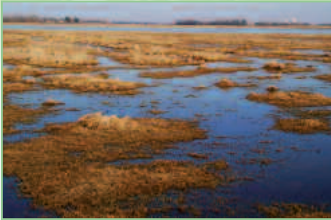
Östliche Wörthenlacke: Hohe Frühlingwasserstände sind eine Voraussetzung für ökologisch intakte Salzlacken.