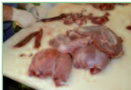
Putzen der Fleischstücke: „Flaxen“ gibt's nicht!

Prinzipiell ist Wildfleisch (Rot- und Damwild, Reh, Feldhase, Wild-