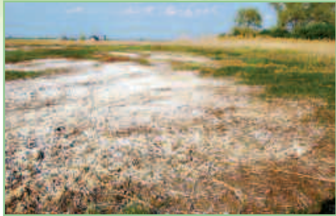
Große Teile der degradierten Legerilacke nördlich von Podersdorf liegen schon im Frühling trocken.

landwirtschaftlicher Kulturen indirekt negativ auf die Spiegellage aus, insbesondere, wenn die Anlagen nicht mehr dem letzten Stand der Bewässerungstechnik entsprechen, wie jene, welche im zentralen Seewinkel leider häufig anzutreffen sind. Davon betroffen sind Sechsmahdlacke, Auerlacke, Kühbrunnlacke, Stundlacke, die Fuchslochlacken, Große Neubruchlacke (od. Obere Halbjochlacke), Kleine Neubruchlacke, Ochsenbrunnlacke, Birnbaumlacke sowie mehrere kleine Lacken in diesem Gebiet.