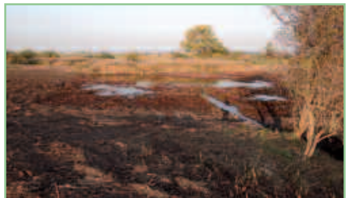
Schilf und Humusschicht wurden bereits größtenteils abgetragen. Es besteht Hoffnung, dass sich verschwundene Pflanzenarten wieder ansiedeln.