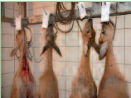
Erlegte Rehe im Kühlhaus: Warten auf fachgerechte Zerlegung

Was war geschehen? Ein nicht lizenziertes Labor des Bundesheeres hatte angeblich in Fleisch von Rehen, die am Truppenübungsplatz Bruckneudorf erlegt worden waren, überhöhte Schwermetallwerte festgestellt. Dazu stellte Landesjägermeister DI Peter Prieler unmissverständlich fest: „Man hat weder ein unabhängiges Labor für die Untersuchung bzw. Kontrolluntersuchung herangezogen, noch hat man die Behörden und die Landesjagdverbände informiert. Hier wurde nichts zum eventuell notwendigen Schutz der Konsumenten getan.“