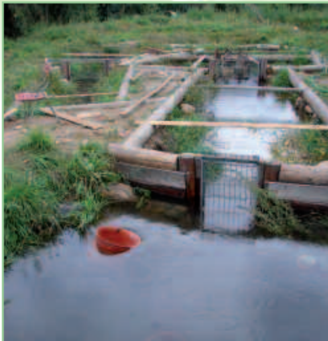
Abb. 2. Das Aufzuchtgerinne in der Gemeinde Lafnitz, hier noch ohne Gitterabdeckungen.

in einem Naturgerinne mit Lafnitzwasser aufgezogen werden und sich überwiegend über Naturfutter ernähren, sollten sie besser an ihren künftigen Lebensraum angepasst sein als Besatzfische aus Teichanlagen.