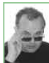
Autor: Dr. Josef Fally, Mitarbeiter des Naturschutzbundes Burgenland

Nicht nur private Haushalte decken sich mit bestem und küchengerichtigem Wildbret ein, auch die Gastronomie lässt sich gerne beliefern. Gut möglich, dass Ihnen, wenn Sie in einem burgenländischen Spitzen-Restaurant etwa einen Wildschweinbraten bestellen, Fleisch aus der Neckenmarkter Direktvermarktung serviert wird.