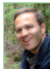
Autor & Fotos: Dr. Georg Wolfram, Geschäftsführer der DWS Hydro- Ökologie GmbH

Fischbestands der Lafnitz. Die Nachzucht wird der Stützung des Bestandes dienen, kann jedoch eine funktionierende Reproduktion in der Natur nicht ersetzen. In den vergangenen Jahren ist viel über den Fischbestand der Lafnitz diskutiert worden, und dank der finanziellen Unterstützung durch ÖNB, öffentliche Hand und EU wissen wir heute mehr über die Lafnitz Bescheid als noch vor 10 Jahren. Dennoch ist es notwendig, weiterhin an den – vermutlich vielfältigen – Ursachen des Bestandsrückganges zu forschen. Den Glauben an das Potenzial dieses einzigartigen Flusses sollten wir keinesfalls aufgeben!