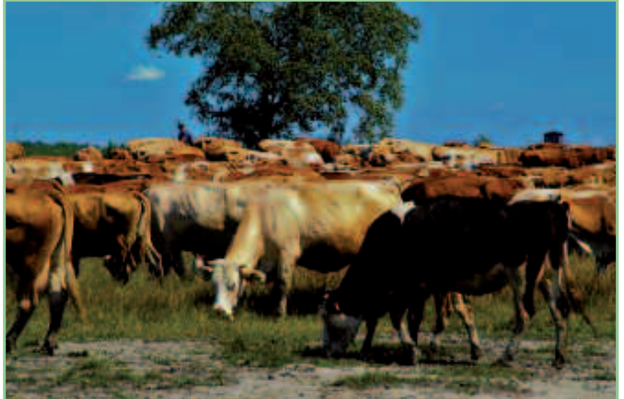
Beweidung Nördliche Martinhoflacke

Das Problem vieler der degradierten Lacken ist einzig und allein die Entsalzung des Lackenbeckens durch einen zu tief abgesunkenen (mittleren) Grundwasserspiegel, wobei sich jeder Dezimeter negativ auf die Salzböden und Sodalacken auswirkt. Wenn in der Praxis der letzten sechs Jahrzehnte vielerorts der mittlere