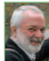
Autor und Foto: Ing. Walter Laschober, Mitarbeiter des Naturschutzbundes Burgenland

Ing. Walter Laschober, E-Mail: walter.laschober@bkf.at Tel: 0664 46 10 103