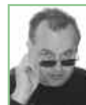
Autor: Dr. Josef Fally, Mitarbeiter des Naturschutzbundes Burgenland