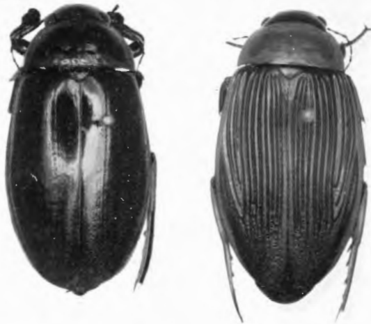
Abb. 1 Dytiscus lapponicus GYLL. 2: 1. — Links Männchen (NSG Harskamp bei Ochtrup/Westfalen), rechts Weibchen (Dörgener Moor bei Meppen).

elbegebiet erwähnt Stern (1914) die Art noch nicht. Ein weiterer Fundpunkt liegt in der Lüneburger Heide (Großer Bullensee). Die Angabe beruht auf einem Fund von Blumberg (12. Jahresber. entomol. Ver. Bremen f. d. Jahr 1924, p. 3), geht jedoch nicht auf Halbfass (1924) zurück, wie Horion (1941) annimmt. An der Unterweser wurde die Art bei Farge gesammelt (Horion 1941). Schließlich meldete Peus (1928) etwa 30 Exemplare von Dytiscus lapponicus für das Dörgener Moor bei Meppen (4 u. 5/ 1925; Belegexple. im Landesmuseum in Münster, Vornefeld/Peus leg. und ex coll. Peetz). Reichling (1926) gibt für den Dümmer an: „Beachtenswert ist auch das Auftreten des in Norddeutschland meistens in Moortümpeln (Kleines Dörgener Moor, Bez. Meppen) vorkommenden, aber seltenen Dytiscus circumcinctus “. Diese Angabe wird von Peus (1928) korrigiert: „Die Art ( D. circumcinctus ) ist im ganzen Münsterland und im Osnabrückschen keine Seltenheit, aber typischer Bewohner alkalischer Gewässer. In Moortümpeln könnte das Tier als Irrgast vorkommen. Belegstücke aus Dörgen besitzt der Autor nicht, auch nicht aus anderen Mooren. Die Angaben beruhen auf einer Verwechslung mit meinen Funden von Dytiscus lapponicus “. Es ist leider nicht ersichtlich, ob Reichling Dytiscus lapponicus im Dümmer gefunden hat. Da Peus (1928) nicht ausdrücklich auf das Fehlen hinweist, ist ein Vorkommen möglich. Goffart (1928) kennt die Art ebenfalls noch nicht aus Westfalen und erwähnt nur das Dörgener Moor.