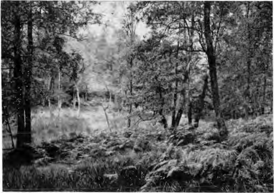
Abb. 6. Im Naturschutzgebiet „Samorsbruch“ am Stimmstamm bei Warstein.

Die mit dem Neuaufbau unserer Organisation verbundene Arbeit und andere Umstände haben es leider unmöglich gemacht, dieses Heft, wie versprochen, zum Weihnachtsfeste erscheinen zu lassen. Wir hoffen, daß es Anfang Januar in den Händen der Bezieher ist, und wünschen allen Lesern und Mitgliedern des „Bundes Natur und Heimat“