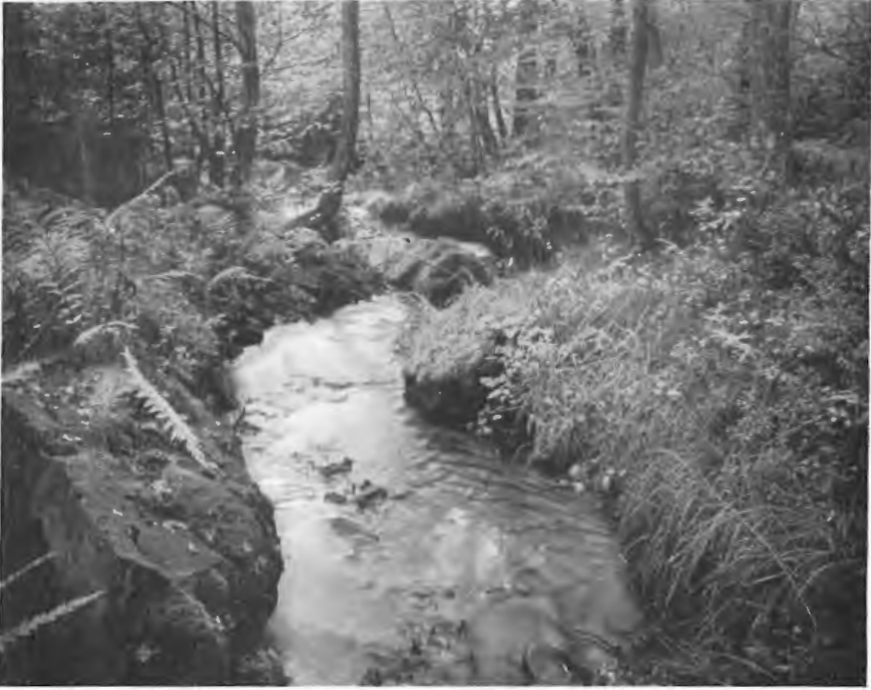
Abb. 3. Blöcke im Tal der „Wilden Ennepe“.