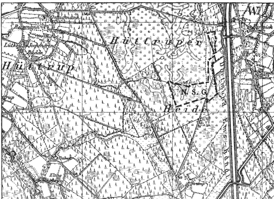
Naturschutzgebiet Hüttruper Heide - - - Grenze des Naturschutzgebietes