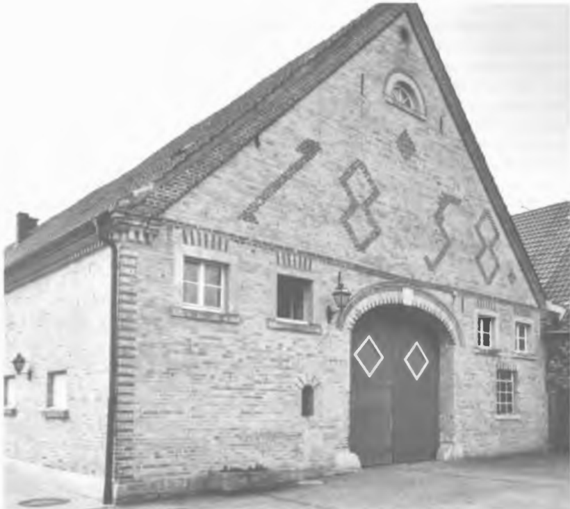
Foto 1: Typisches Hauptgebäude eines münsterländischen Bauernhofes mit Ziegel- und Sandsteinband unterhalb der Dachrinne, als Brutplatz von Mehlschwalben nicht geeignet.

Die Bedeutung der Mehlschwalbenbrutplätze auf landwirtschaftlichen Betrieben Münsters bleibt dennoch groß, weil sich hier die großen Kolonien befinden, die weitgehend ungestört ihrem Brutgeschäft nachgehen können und damit vermutlich hohe Reproduktionsraten aufweisen. Sie dürften die Regenerationsbasis für die durch Nestzerstörung stark gefährdeten Kolonien in benachbarten Wohngebieten darstellen. Im Osten Münsters habe ich 6 Kolonien mit 10 und mehr Brutpaaren festgestellt, davon befinden sich 5 mit insgesamt 80 Paaren auf landwirtschaftlichen Betrieben, nur eine mit 14 Paaren an einem 2-stöckigen Wohnhaus.