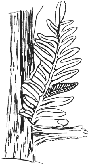
Abb. 2. Alethopteris lonchitica Schloth. nach Gothan-Franke.

Gegenüber den liegenden, flözführenden Schichten nimmt die Zahl der Konglomeratbänke in den jüngeren Ablagerungen der Kohlenzeit zu. Die