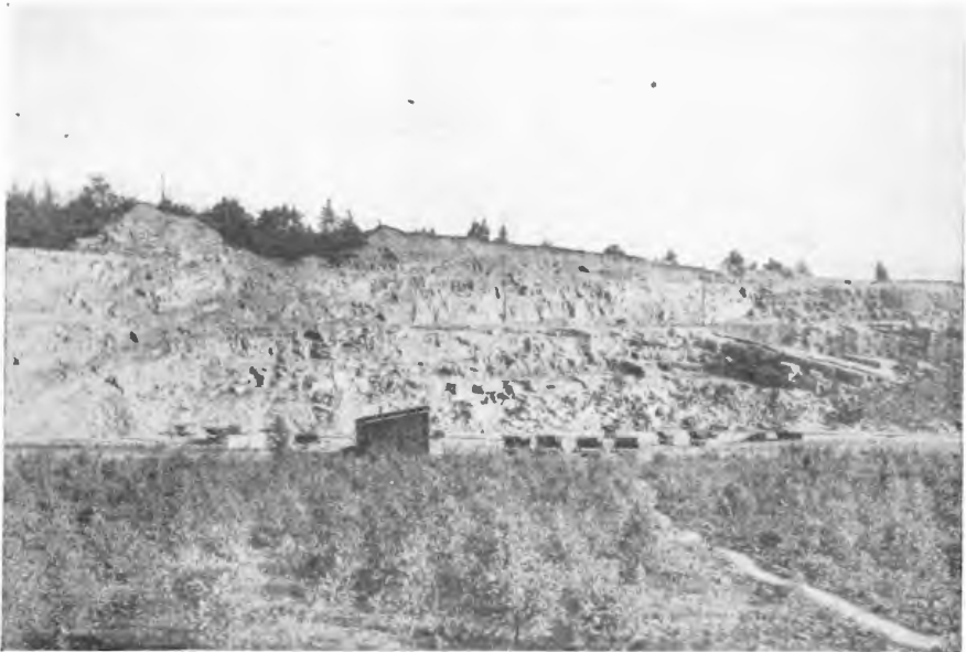
Abb. 1. Staatlicher Steinbruch im Karbon des Kälberberges bei Hopsten.

Bekanntlich ragt im Nordwesten Westfalens ein Kohlengebirge, das Ibbenbürener Plateau, über die Nordwestdeutsche Ebene empor. An Bruchspalten ist das umliegende Gebiet gegen das Kohlengebirge in die Tiefe gesunken. Das höher liegende Plateau ist also als ein Horst anzusprechen. Auch der Kälberberg in der Nordwestecke des Plateaus ist relativ gegen das Plateau gesunken. Dadurch sind die jüngsten Schichten des Karbons in das Niveau der Ibbenbürener Bergplatte gebracht und uns erhalten geblieben. Im übrigen Teil der Bergplatte, namentlich am Südrande, sind diese höheren Schichten in der Folgezeit fast vollständig abge-