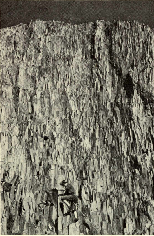
Im Hoggargebirge (Taheleft-Südgrat)

Straße. Teilweise steil ansteigend, mit groben Felsbrocken übersät und mit tiefen, von den Regenfällen des Winters herausgewaschenen Längs- und Querrinnen. Die Steigung wird so groß, daß nur noch Schieben hilft, aber schließlich stehen wir mitsamt unserem Gefährt am Sattel von Assekrem . Hoch darüber, am Rand eines Hochplateaus, steht eine Hütte und vor ihr, sich scharf gegen den blauen Himmel abhebend, ein Mensch. Wir wissen, daß wir hier nicht allein sein werden; wir haben sogar Post für den einsamen Mann dabei. In Tamanrasset hatten uns französische Schwestern erzählt, daß inmitten des Gebirges zwei Eremiten hausen würden, Nachfolger von Charles de Foucauld, dem ersten Missionar des Hoggar.