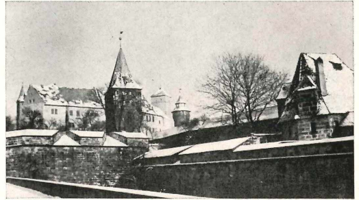
Abb. 1 Die Nürnberger Kaiserburg mit Tiergärtnertorbastei und Stadtgraben im Neuschnee.

Sein nächster Verwandter ist der etwas kleinere Baumarder ( Martes martes ). Dessen ungegabelter Kehlfleck hat goldgelbe Farbe, wovon sich der Beiname „Goldkehlchen“ ableitet. Dichte dunkelbraune Grannenhaare und gelbe Unterwolle machen den Pelz des Baumarders zu einem geschätzten Rauchwerk. Davon kündigt sein weiterer Name „Edelmarder“.