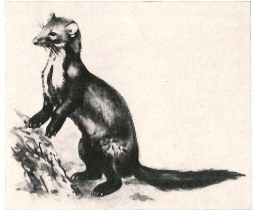
Abb. 2 Steinmarder (Weißkehlchen).