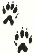
Abb. 3 Fährte (Schrittspur) des Steinmarders.