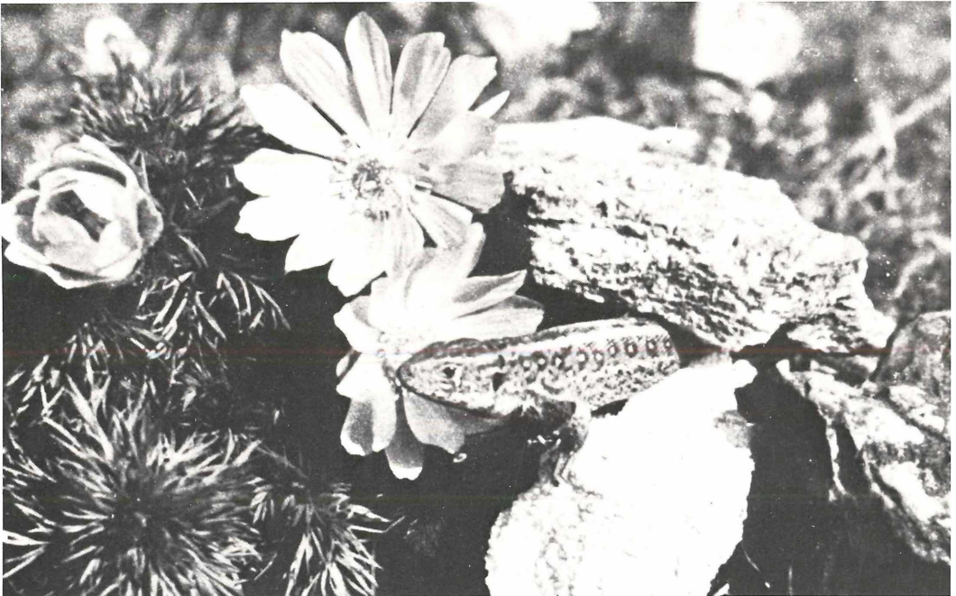
Frühling im Naturschutzgebiet bei Kilsheim in Mittelfranken! Die goldgelben Blüten von Adonis vernalis öffnen sich und die Zauneidechse verläßt ihr Winterquartier. Alabasterweiß leuchtet das Gipsgestein in der Sonne.