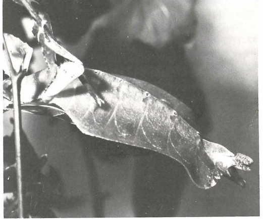
Bei der Eiablage

Die erstaunliche Ähnlichkeit des „Wandelnden Blattes“ mit der Form und Färbung seiner Umgebung sind ein extremes Beispiel für schützende Ähnlichkeit (Mimikry). Sogar die Beine haben die Form von „Blättern“ und auf dem Rücken der Tiere lassen sich „Blattadern“ erkennen. So vollkommen getarnt und an ihre Umgebung angepaßt, können ihre Feinde sie nur schwer entdecken.