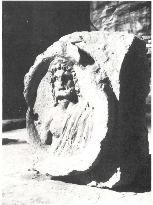
Relief eines Gottes im Medaillon, das vor kurzem in Wadi Musa gefunden wurde und heute auf den Stufen zum Museum von Petra ausgestellt ist.