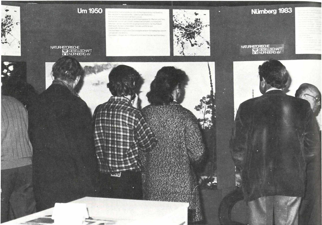
Besonders vor den letzten Bildern stauten sich immer wieder interessierte Besucher.