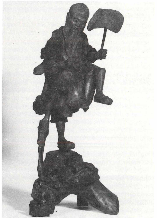
Holzfigur , Mann mit Bart darstellend, China, 38 cm hoch geschnitzt aus Wurzelstock

Dauerleihgaben aus der Sammlung von Frau Wagner