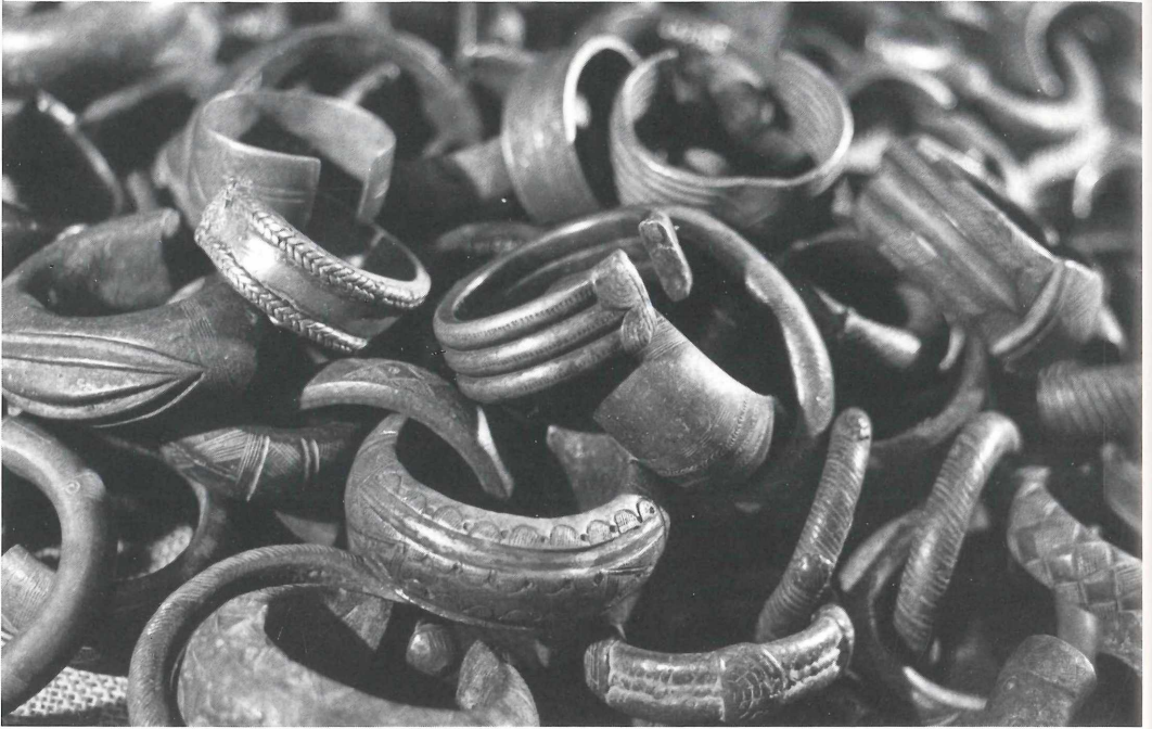
Manillen aus der Schenkung Scheer im Museum der NHG

Medizinmann, der sie als Totem gegen Krankheiten anbot. In Dakar ist im Nationalmuseum ein Häuptlingsgrab mit Manillenbeigaben nachgebildet. Auch die Museen in Niamey, Ouagadougou und Kumasi zeigen Manillen. Nicht weit vom Badestrand bei Lome bieten die Händler den Touristen Manillen, aber auch Imitationen an.