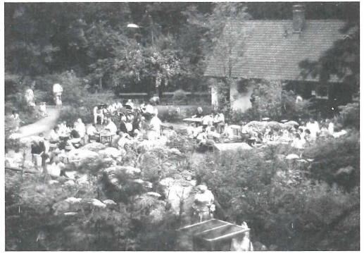
Am "Tag der offenen Tür" konnten die Besucher unsere schöne Anlage bei strahlender Sonne so richtig genießen.

Veranstaltungen ab. Gemeinschaftliche Aktivitäten wie diese, zwischen Abteilungen mit ähnlich gelagerten naturkundlichen Interessen, könnte ich mir künftig durchaus vorstellen. Sie wären eine Bereicherung für die Öffentlichkeitsarbeit der Naturhistorischen Gesellschaft.