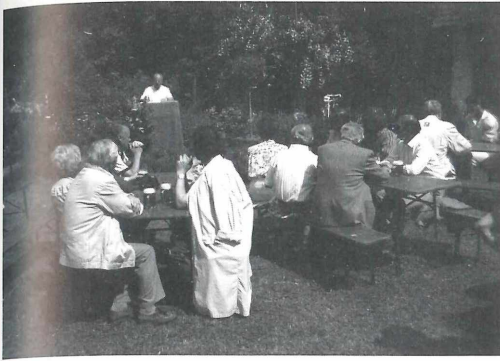
Der Obmann begrüßt bei der Einweihungsfeier die geladenen Gäste.