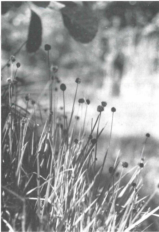
Abb. 2 Die Schwertblättrige Binse am Fundort bei Nürnberg. Orig., 4. 8. 1990

ursprüngliche Verbreitung bis nach Alaska und erreicht über die Aleuten die Kurilen und Japan. Isoliert davon ist das Vorkommen im Süden der James-Bucht in West-Kanada.