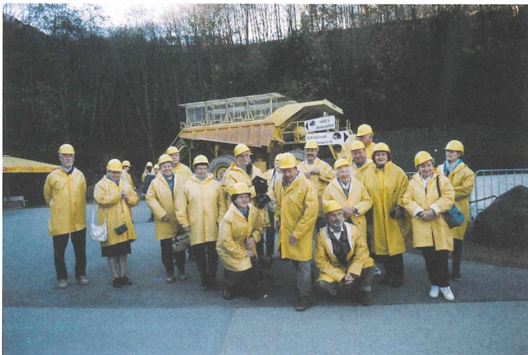
Abb. 4: Die Gruppe vor dem Bergwerk am Erzberg, im Hintergrund ein Erztransporter (Hauly), der für Besuchsfahrten umgerüstet wurde.

der TU Graz, der uns die komplexen chemischen und geologischen Vorgänge anschaulich erläuterte. Für die Klopfer gab es reichlich Gelegenheit, rot- und blaugefärbte Belegstücke des Opals zu sammeln. Den Abschiedsabend gestaltete Frau Susi König, selbst Teilnehmerin der Exkursion, die uns mit großem Können die Kunst des Bauchtanzes nahebrachte.