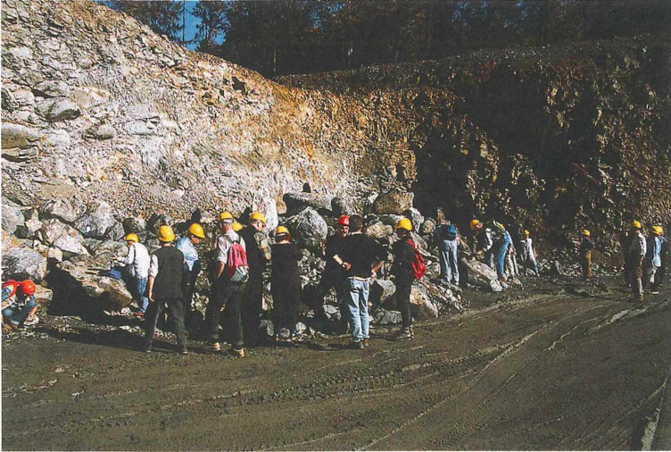
Abb. 1: Im Steinbruch der Basaltwerke Klöch ergab sich für alle die Gelegenheit, Zeolithite zu finden.

Abend informierte uns Herr Dr. Hesse über die Geschichte der Gegend um Semriach und über den intensiven mittelalterlichen Bergbau auf Silber, Kupfer und Eisen. Dr. Hesse forscht derzeit u. a. über den Einfluß der Nürnberger Patrizierfamilie Holzschuher in dieser Gegend, deren Name um 1500 häufiger in Verträgen und Urbaren auftaucht.