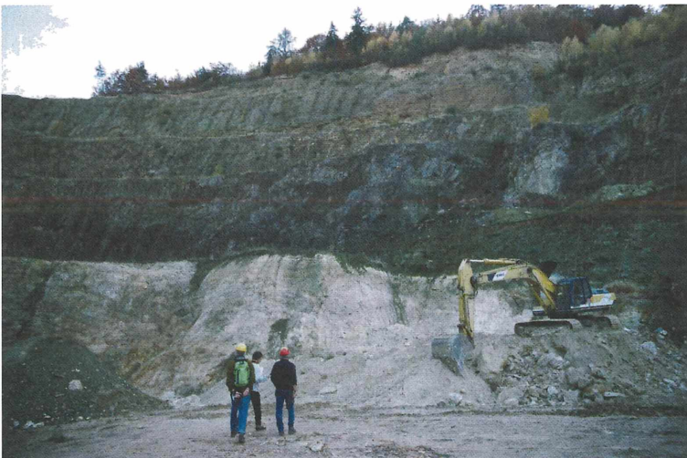
Abb. 2: In Gossendorf wird Traß abgebaut. Der Bagger steht direkt auf diesem Mineralgemenge aus Opal-CT und Alunit.

Der vierte Tag führte bei bestem Wetter ins oststeirische Vulkanland. Der neogene steirische Vulkanismus weist zwei Phasen auf. Im Miozän, vor ca. 16 Mio. Jahren, wurden saure, latitische Magmen gefördert; die pliozäne Phase vor ca. 2 Mio. Jahren weist basische, basaltische Laven auf. Der Burgfelsen der Riegersburg, unserem ersten Ziel, ist eine herausgewitterte pliozäne Schlotfüllung, die einen eindrucksvollen Standort für eine der schönsten und besterhaltenen österreichischen Burganlagen bietet. Nie erbort, wurde die Rie-