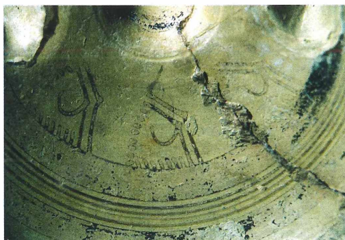
Abb. 3: Detailaufnahme der stilisierten Blüten auf der Schulter der Bügelkanne der NHG.