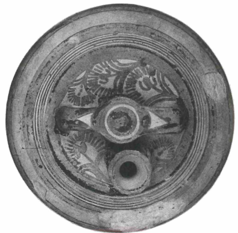
Abb. 7: Diese Aufnahme der Bügelkanne aus Abb. 6 zeigt auf deren Schulter das Dekor von früheren, weniger stilisierten und daher noch erkennbaren Blüten.

geschweiften und flachen Bügelkanne wird seltener, die runde, bauchige Form wird an deren Stelle populär. Die Dekoration ist insgesamt eine Fortsetzung der ersten Phase mit den gleichen Verzierungsmotiven, ist aber jetzt dichter gefügt und wirkt dadurch dunkler und schwerer.