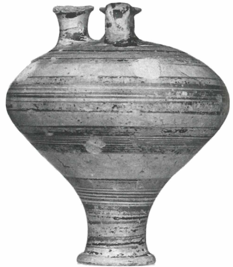
Abb. 6: Eine Bügelkanne der geschweiften Form der Phase SH III A:2 in der Antikensammlung der FAU in Erlangen.

Die spätere Phase SH III B:2 ist schwieriger einzugrenzen, da sich in den Gräbern weniger bemalte Keramik befindet. Charakteristisch sind Schalen mit monochromem Inneren und einem breiten Streifen an der Außenseite der Lippe oder einer Rosetten-Verzierung an der Außenseite. Außer den Skyphoi, welche die am stärksten vertretene Form sind, gibt es noch große Lekanen, Bügelkannen, Kragenhalsamphoren, Kratere und Kylikes. Die Form der