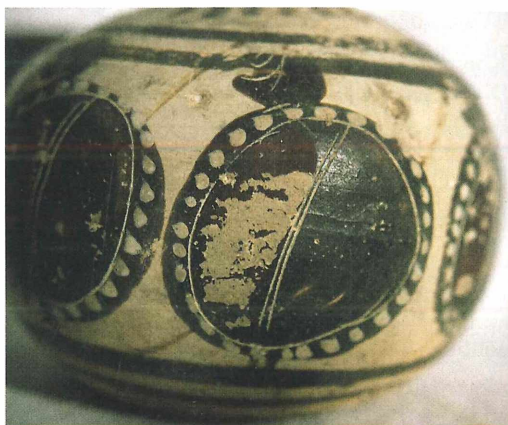
Abb. 12: Aryballos der NHG. Detailaufnahme eines Kriegers mit Rundschild und Lanze.

Die kreisrunden Schilde werden in der Mitte durch zwei Ritzlinien in zwei Hälften geteilt, deren vordere bei allen Krieger roten Farbauftrag besitzt. Zusätzlich grenzt eine Ritzung den ringsum mit weißen Punkten verzierten Schildrand ab. Die Innenzeichnung der Köpfe besteht aus mehreren Ritzungen: Ein kurzer Strich trennt den Kopf vom Rund des Schildes, zwei weitere markieren den Mund und den Haaransatz, eine runde Ritzung zeigt jeweils das Auge an. Die Krieger sind mit Lanzen bewaffnet, deren untere Enden vor den kleinen Füßen und deren Spitzen hinter den Köpfen erscheinen. Nach unten hin grenzen drei weitere umlaufende Streifen das Bildfeld ab. Der Henkel des Aryballos weist drei vertikale Linien auf, die Rückseite unter dem Henkel ist unverziert.