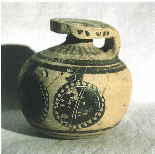
Abb. 10: Der Aryballos der NHG ist kuglrund und der Bauchfries zeigt vier marschierende Hopliten.