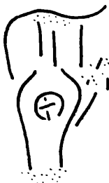
Abb. 5: Linear-B-Ideogramm der Bügelkanne auf einem Tontäfelchen aus Pylos (nach Mountjoy, S. 81, Fig. 187)

Im 2. Jahrtausend v. Chr. wird zum ersten Mal eine gleichartige Keramik im mittleren und östlichen Mittelmeerraum hergestellt. Dies ist ein Indiz für die engen Kontakte der mykenischen Zentren untereinander. Die Keramik dieser Zeit ist so gut wie ausschließlich scheibengestöpft, und als Verzierungen sind Pflanzen und Meerestiere weit verbreitet. Die vorangehende minoische Kunst bildete Pflanzen und Tiere möglichst naturgetreu ab, die Darstellungen waren schwungvoll und organisch, plastisch und lebendig. Die mykenische Kunst dagegen geometrisiert die Natur. Die einzelnen Objekte scheinen jetzt geradezu ornamental erstarrt zu sein, die organischen Darstellungen wirken leblos und die Proportionen verfremdet.