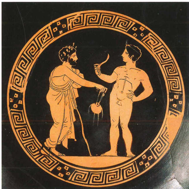
Abb. 9: Innenbild einer attisch rotfigurigen Schale der Antikensammlung der FAU in Erlangen. Zu sehen ist ein bärtiger Mann, der einem Sportler einen Aryballos reicht. Der junge Mann hält die Strigilis, das Schabeisen, in seiner rechten Hand. I 269.

Aryballoi und Alabastra sind die am häufigsten vorkommenden Gefäßtypen dieser Zeit, deren Benennungen allerdings nur Konventionen der modernen Wissenschaft. Sie wurden nicht nur in Korinth hergestellt, sondern auch in anderen Gegenden Griechenlands und Italiens. Die dort heimischen Töpfer ahmten, teils täuschend