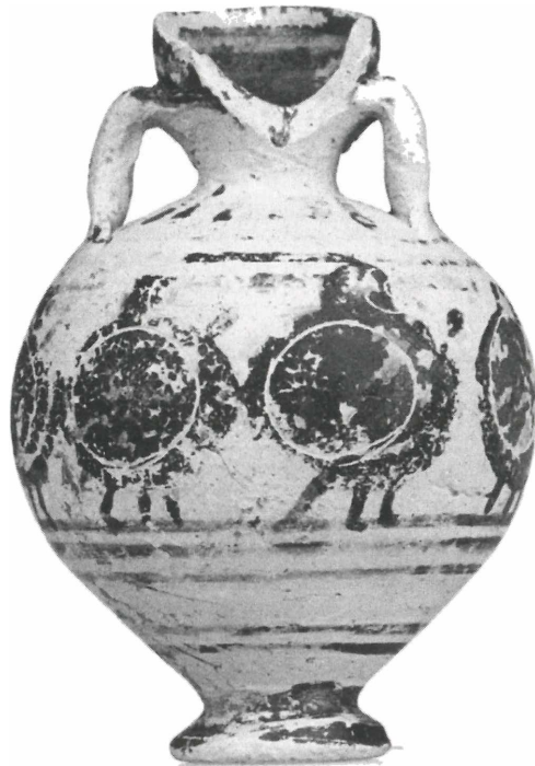
Abb. 13: Amphoriskos in der Antikensammlung der FAU in Erlangen. Auf dem Bauchfries marschieren sieben Krieger mit Rundschilden, Lanzen und Helmen.

In der zweiten Phase besitzen die Aryballoi konzentrische Kreise auf dem Mündungsteller und Punkte am Rand desselben. Auf der Schulter erscheinen ein Zungenband und mehrere umlaufende Streifen, ebenso wie auch weitere Streifen unter dem Hauptfries. Der Henkel kann mit horizontalen oder vertikalen Bändern oder Zickzacklinien verziert sein. Die Hauptfriese dieser Phase können verschiedene Orna-