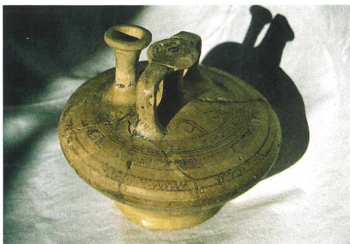
Abb. 2: Die Bügelkanne der NHG in Schrägsicht.