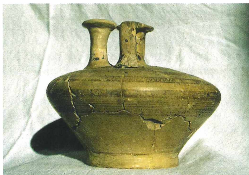
Abb. 1: Die Seitenansicht der Bügelkanne der NHG zeigt deren flaches Profil.

Bereits zu Lebzeiten übergab er einen Teil seiner beträchtlichen Privatsammlung antiker Altertümer der NHG, der sich heute in den