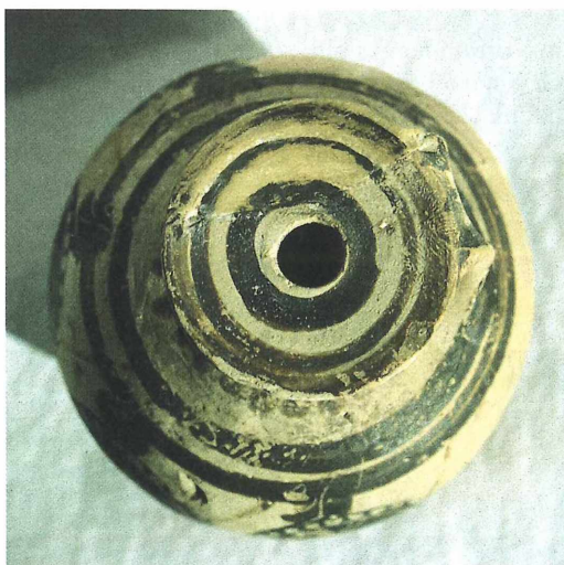
Abb. 11: Aryballos der NHG. Die Aufnahme von oben läßt die konzentrischen Kreise auf dem Mündungsteller und die Köpfe der vier Krieger erkennen.