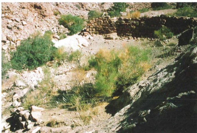
Abb. 5: 35 m lange Staumauer aus nabatäisch-römischer Zeit im tief eingegrabenen Wadi Mirwan unterhalb von Umm Saysaban.

deutlicher heraus, daß es sich nicht um einen Tempel, sondern um ein öffentliches Gebäude handelt, das vermutlich die Macht des nabatäischen Königshauses demonstrieren sollte. Das „theatron“ ist inzwischen freigelegt und man ist dabei, gestürzte Säulen wieder aufzustellen. In nicht zu ferner Zukunft wird man beim Gang durch den „Cardo“ in kleinen Läden einkaufen können, die aus antiker Zeit stammen und neuerdings (wieder) freigelegt wurden. Die Schweizer Ausgrabung auf und in Zantur erbringt immer neue Überraschungen. Der Gedanke, daß hier - zumindest zeitweise - ein Königspalast war, wird nicht mehr kategorisch