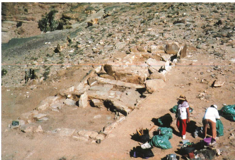
Abb. 3: Die beiden Räume (Häuser) nach Abschluß der Grabung 1999.

Keramik aus später römischer Zeit (Abb. 4). Der Felskamm konnte bei drohender Gefahr nicht alle Bewohner der Siedlung aufnehmen, aber etwa Bogenschützen Deckung geben. Nach Osten zu deutet eine große, sehr sorgfältig gearbeitete Weinpresse umfangreichen Weinbau an. Eine Zisterne, die ursprünglich