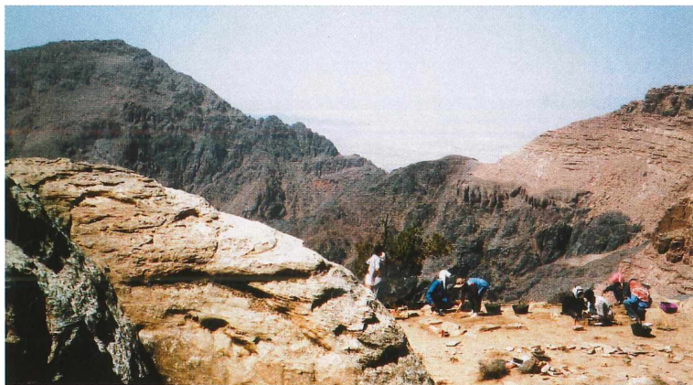
Abb. 1: Grabungsplatz auf dem Umm Saysaban-Plateau 1999. Im Hintergrund das Wadi Araba.

Das zweite Projekt war die Untersuchung eines Wohnkomplexes im Norden von Petra. Hier erhebt sich ein schmaler, im Altertum mit Mauern befestigter Felskamm über einer Ebene mit den Resten von etwa zehn großen Häusern. „Shamase“ stammt nach der aufgelesenen