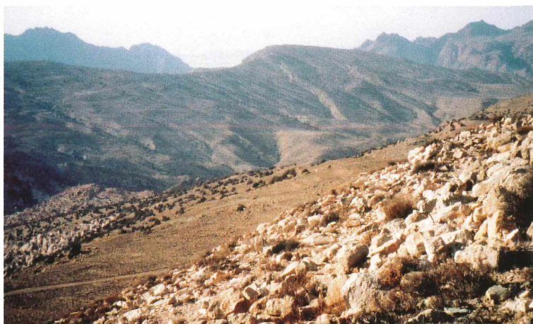
Abb. 6: Von der neu identifizierten edomitischen Siedlung en-Iraq gab es Sichtverbindung zu den von der NHG entdeckten Siedlungen auf dem J. Suffaha-Massiv.