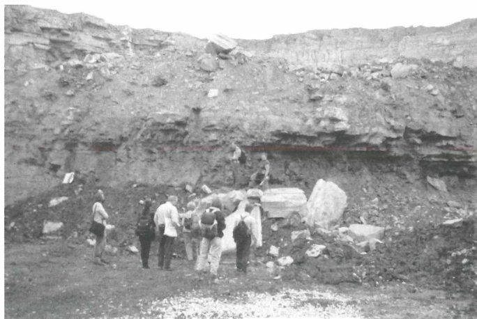
Die Teilnehmer der geologisch-karstkundlichen Exkursion vom 29. August im Steinbruch bei Hartmannshof beim Studium der Dogger-Malm-Grenze.

Abteilungsintern gab es darüber hinaus, wie seit vielen Jahren üblich, noch ein eigenes Programm mit Referaten, Exkursionen und weiteren Unternehmungen. Eine Neuerung war hier die Einführung eines „Info-Abends“ jeweils