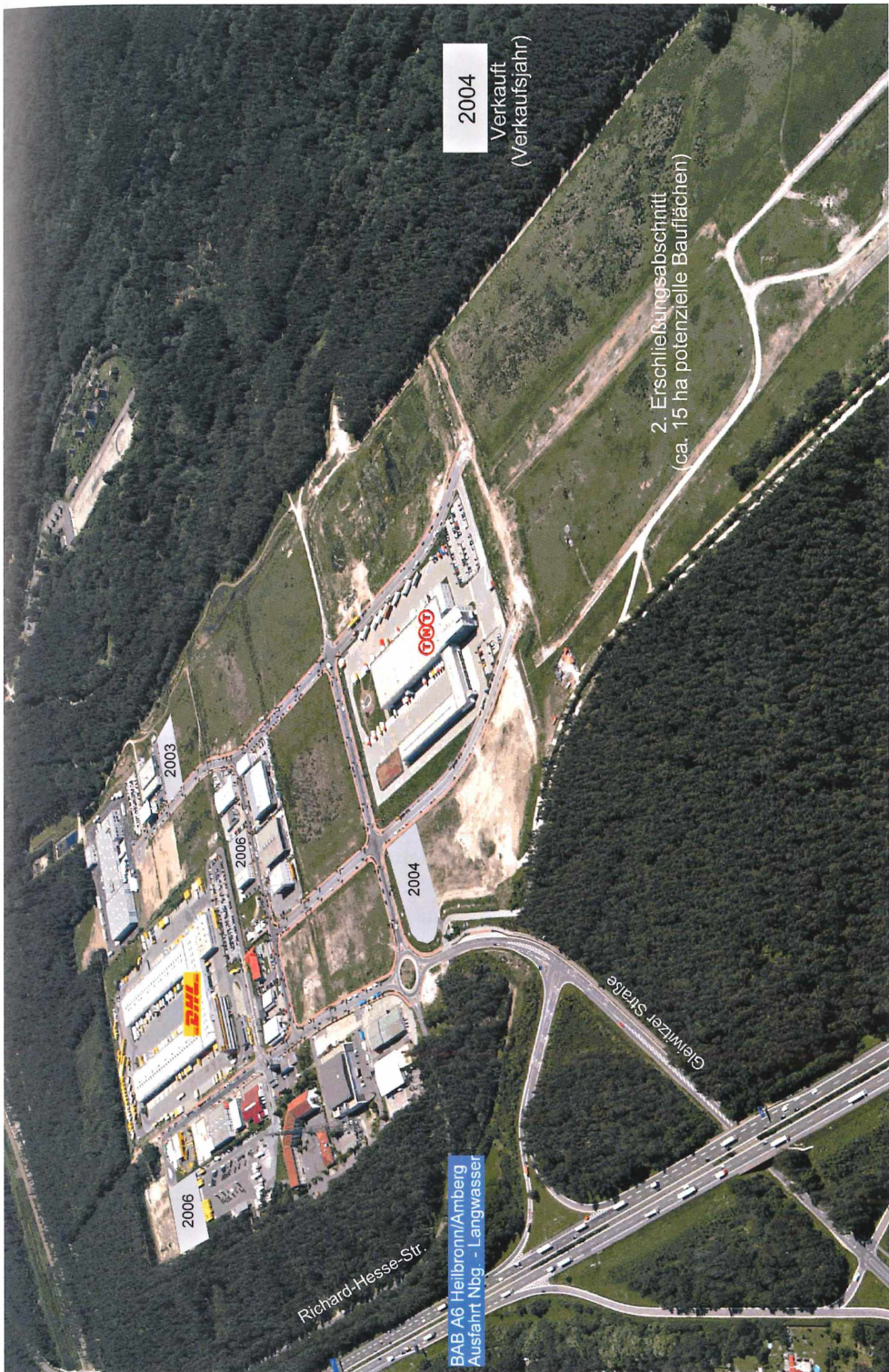
Abb. 3 Aktuelles Luftbild des Gewerbeparks Nürnberg-Feucht-Wendelstein von Nordwesten. Es zeigt den inzwischen erreichten Stand der Belegung mit Betrieben im Osten und in der Mitte des Areals sowie die für Anstedlungen noch verfügbaren Flächen vor allem im Westen.