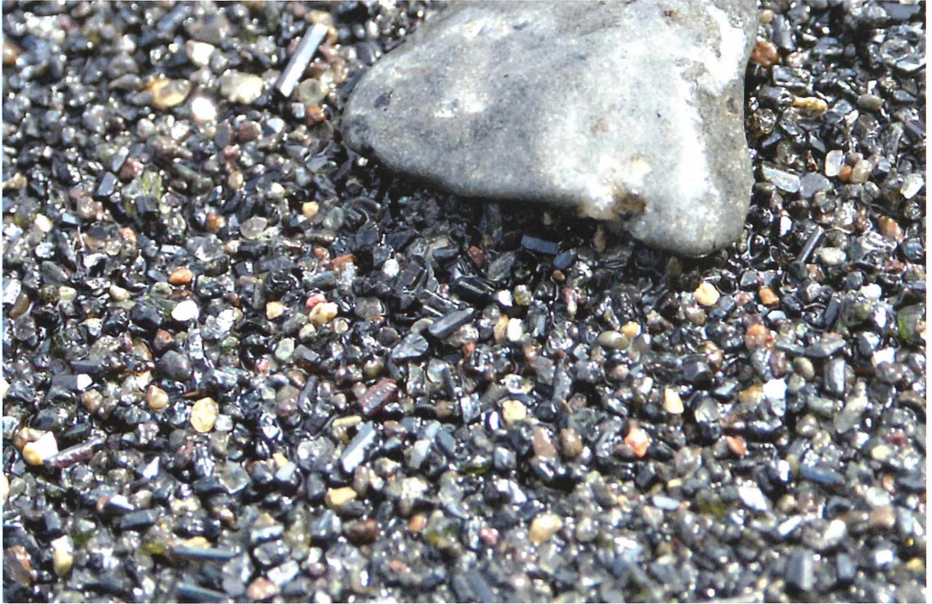
Abb. 2: Der Bolsena-See in Mittelitalien liegt in einer vulkanischen Caldera. Es dominieren undurchsichtige schwarze und – seltener – durchsichtige grüne Minerale. Die prismatische Kristallform ist gut erhalten und lässt vor allem Pyroxene erkennen.