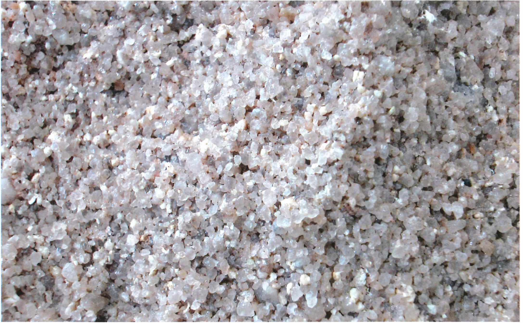
Abb. 1: Charakteristischer, nur schwach zementierter Keupersandstein aus dem Nürnberger Raum. Die Quarzkörner haben einen durchschnittlichen Durchmesser um 1 mm, dazwischen sind einige wenige weiß- bis rosafarbene Feldspatkörner eingelagert.