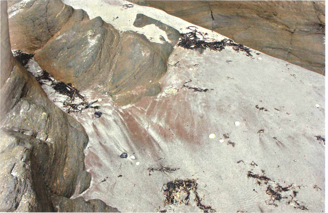
Abb. 4: Granat ist ein Mineral mit ähnlicher Härte wie Quarz. An Küsten mit metamorphen Gesteinen kann es rote Grana-sande geben. Ile de Groix/Bretagne