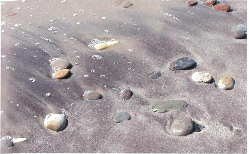
Abb. 3: Die reichlich mit eiszeitlichen nordischen Geröllen angereicherten Küsten der Ostsee führen zu lokalen Konzentrationen unterschiedlichster Sand-Partikel. Rote Farbstreifen sind aus Feldspat, schwarze aus Pyroxenen und Hornblenden zusammengesetzt. Südküste von Bornholm