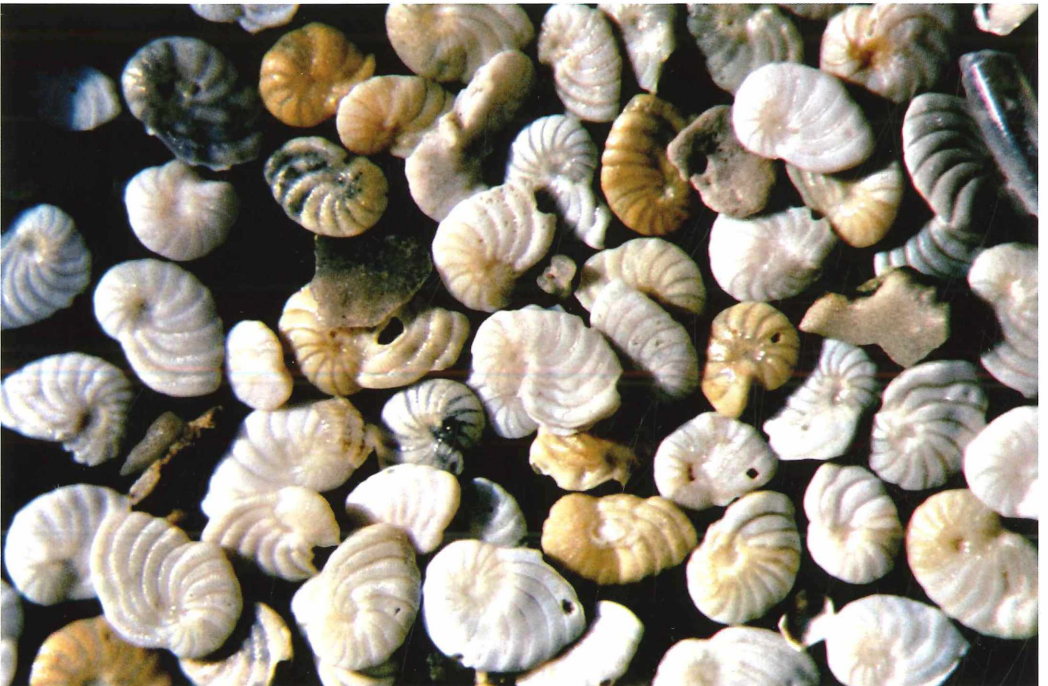
Abb. 6: Foraminiferen ( Peneroplis sp.) aus Porec/Istrien. Maßstab: Bildbreite 3 mm