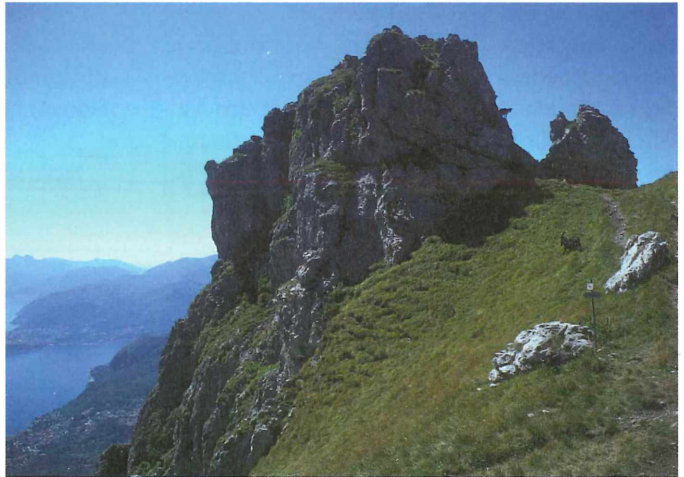
Gipfelbereich des Monte Grona

Wegen des schlechten Wetters war keine größere Wanderung möglich, das Tagesprogramm wurde improvisiert. Zuerst suchten wir nach den Felszeichnungen bei Rezzonigo, die so wenig auffindbar waren wie die Maya-Tempel im mittelamerikanischen Urwald vor ihrer Entdeckung. Dazu wanderten wir ein Stück auf der Via Regina, einer alten Römerstraße, die nach Norden zu den Alpenpässen führte. Nachmittags war eine Wanderung zum Monte Grona (1736 m) oberhalb von Menaggio im Angebot. Der Ausgangspunkt sind die Monti di Breglia (996 m), die oberhalb von Menaggio liegen. Von dort führt ein Wanderweg zum Rifugio Menaggio (1380 m). Über den Sentiero Panoramico erreicht man in 2 Stunden den Gipfel (1736 m). Doch durch das schlechte Wetter war die Hütte am Nachmittag nicht mehr zu erreichen. Der Monte Grona hat bei Botanikern einen guten Namen. Bei meiner Begehung im Sommer 2005 waren interessante Arten bereits verblüht, der Weg ist teilweise auch sehr ausgesetzt.