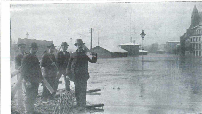
Das Hochwasser in Frankfurt a. M.