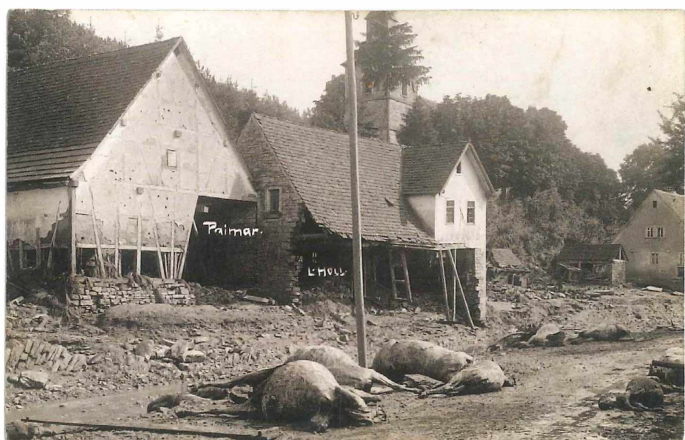
Abb. 12-13: Postkarten aus dem Jahr 1911 (Paimar)

Altmühltal heraufgeschafften Kähnen mit Lebensmitteln.