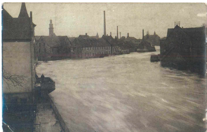
Abb. 3-5: Postkarten aus dem Jahr 1909 (Erläuterung im Text)