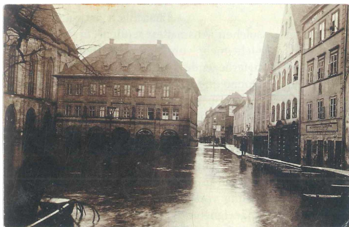
Abb. 9-11: Postkarten aus dem Jahr 1909 (Köln, Vilseck, Amberg)

Auf der Jurahochfläche um Eutenhofen, östlich von Dietfurt an der Altmühl, bildete sich durch Unmengen von tauendem Schnee und starke Regenfälle ein See von ca. 5 km 2 Größe, der einige Tage stehen blieb. Das Wasser auf der Hochfläche stieg so schnell, dass 40 Stück Klein- und 7 Stück Großvieh noch in den Ställen ertranken. Außerdem entstand großer Sachschaden. Fischer aus Meihern versorgten die Bevölkerung der Dörfer mit eigens aus dem über 100 m tiefer gelegenen