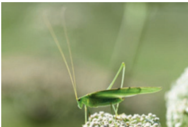
Abb.1: Feuchtfur bei Wurms 08.08.2020