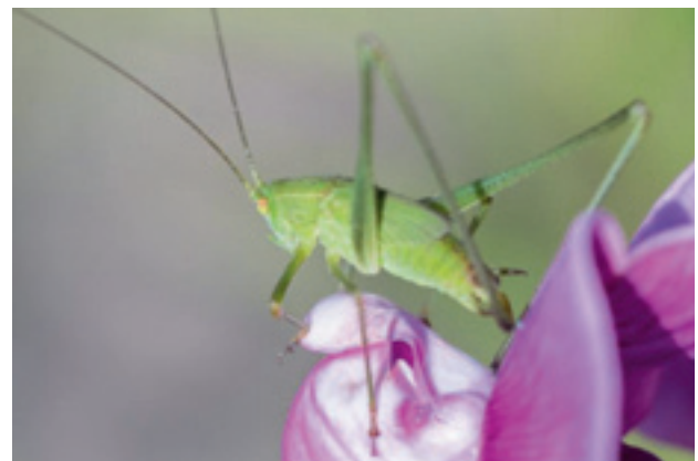
Abb. 2: Kiesgrube Gemeinderied - Nympe 12.07.2022