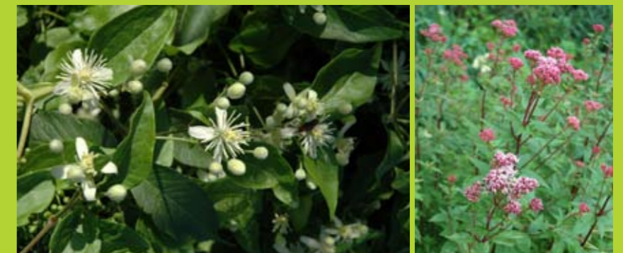
Blühbeginn Gewöhnliche Waldrebe