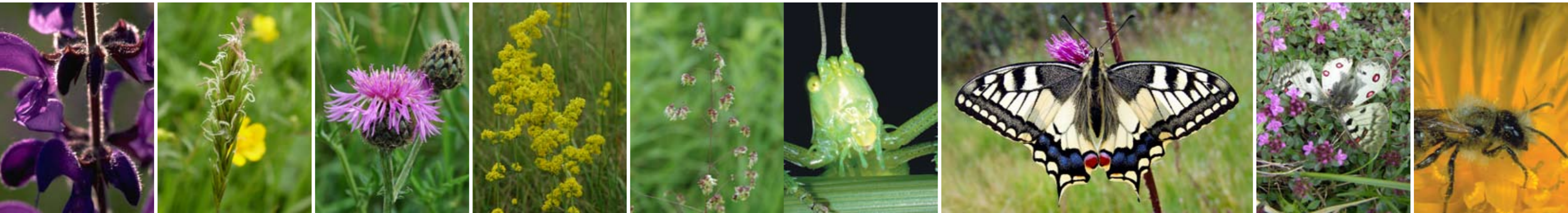
Wiesensalbei Ruchgras Skabiosen-Flockenblume Echtes Labkraut Zittergras Heuschrecke Schwalbenschwanz Apollofalter auf Thymian Biene