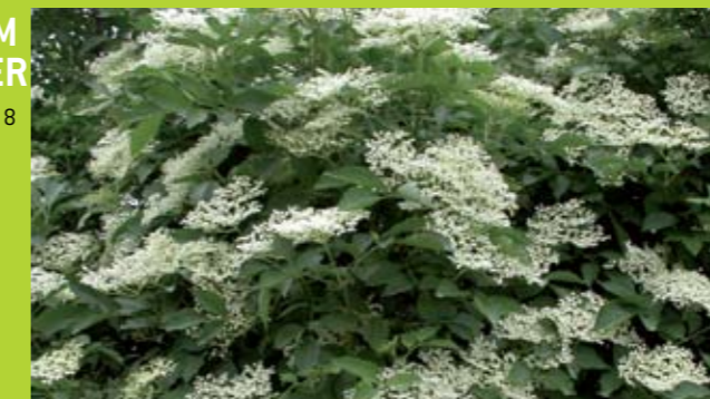
Nährstoffreiche Standorte: Vollblüte Schwarzer Holunder