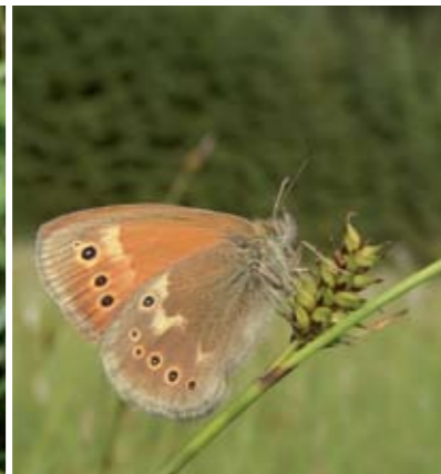
Großes Wiesenvögelchen auf Segge