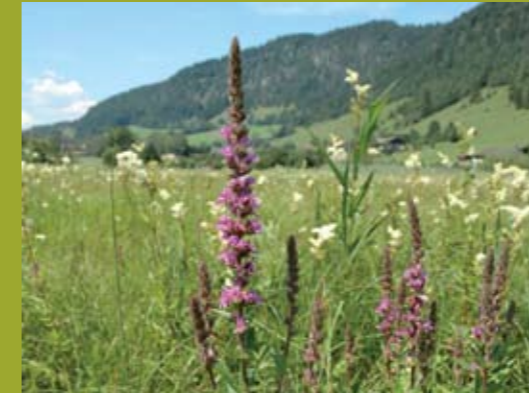
Blutweiderich, Blühbeginn idealer Mähzeitpunkt für Trockenmagerwiesen, die später ausfruchten