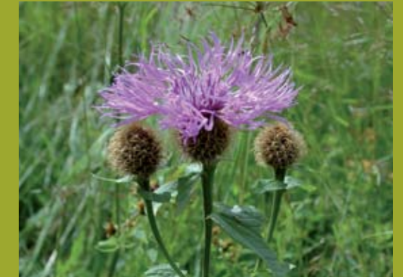
Perückenflockenblume Blühbeginn, idealer Mähzeitpunkt für Trockene Wiesen, die früher ausfruchten