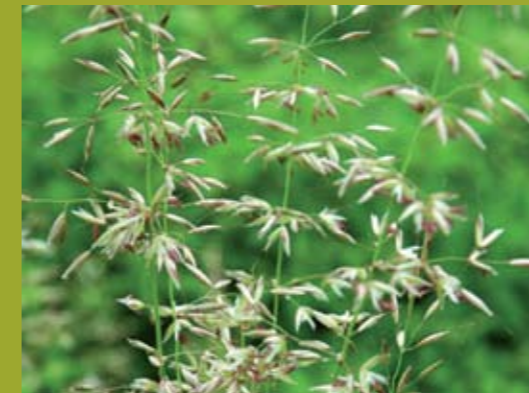
Glatthafer Vollblüte, idealer Mähzeitpunkt für Glatth- und Goldhaferwiesen