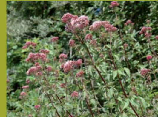
Wasserdistel, Blühbeginn, idealer Mähzeitpunkt für Kleinsiegenried und trockene Magerwiesen, die spät ausfruchten

Beispiele für Zeigerarten mit ihren zugehörigen Blüh- oder Fruchtphasen sind mit dazugehörigen Fotos in jedem Kapitel angeführt.