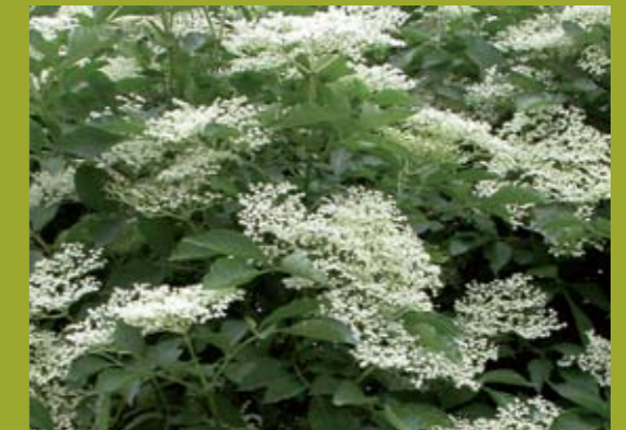
Schwarzer Holunder Vollblüte, idealer Mähzeitpunkt für Glatthaferwiesen und Kohl- und Bachdistelwiesen