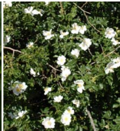
Hundsrose in Vollblüte