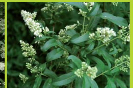
Nährstoffarme Standorte: Blühbeginn Gewöhnlicher Liguster