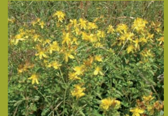
Johanniskraut Blühbeginn, idealer Mähzeitpunkt für Trockenmagerwiesen, die früher ausfruchten