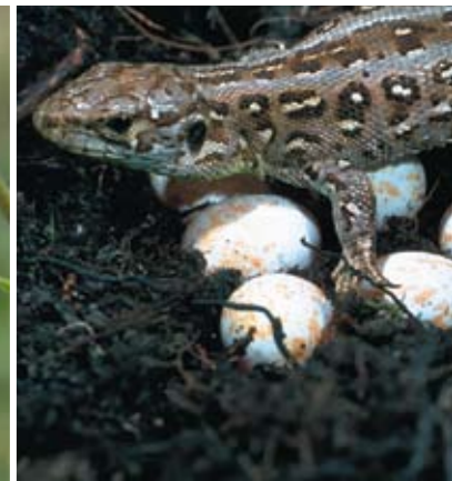
Zauneidechse mit Eiern