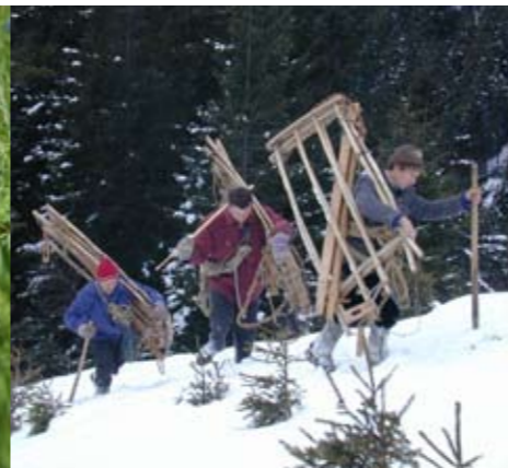
Heuziehen im Winter