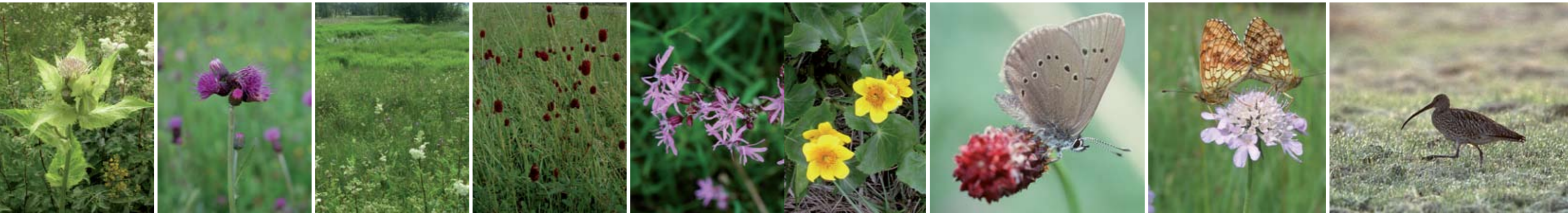
Kohlthistel Bachdistel Mädesüß Großer Wiesenknopf Kuckucks-Lichtnelke Sumpfdotterblume Ameisenbläuling Mädesüß-Perlmutterfalter Brachvogel