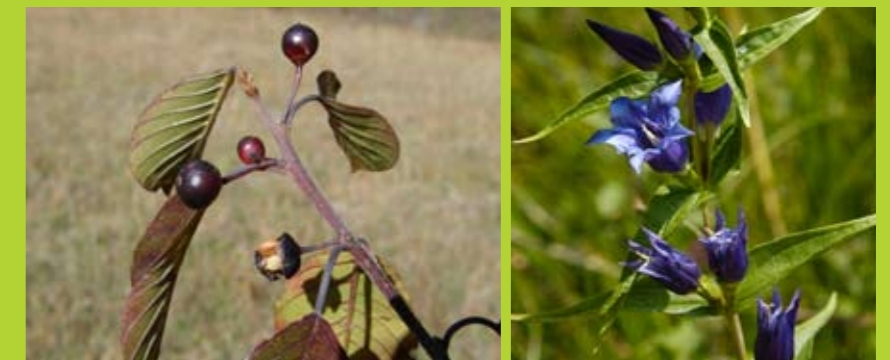
Beginnende Fruchtfärbung des Faulbaums Blühbeginn Schwalbenwurz 15