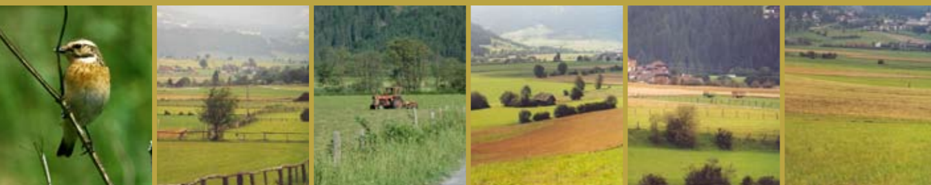
Braunkelchen Brutplatz der Braunkelchen Lungauer Talboden Hecken im Lungau Ackerflächen im Lungau

Für die Nahrungssuche braucht das Braunkehlchen Ansitzwarten, wie Zaunpflocke, niedrige Hecken und Sträucher. Deshalb sind der naturverträgliche Umgang mit Landschaftselementen und die Erhaltung der Hecken und Raine, Teil der Pflegeauflagen. Um eine erfolgreiche Brut zu gewährleisten, ist die Befahrung der Förderflächen zwischen dem 1. Mai und dem 20. Juni nicht möglich. Je nach Art der Bewirtschaftung ergeben sich unterschiedliche Auflagen und Prämien.