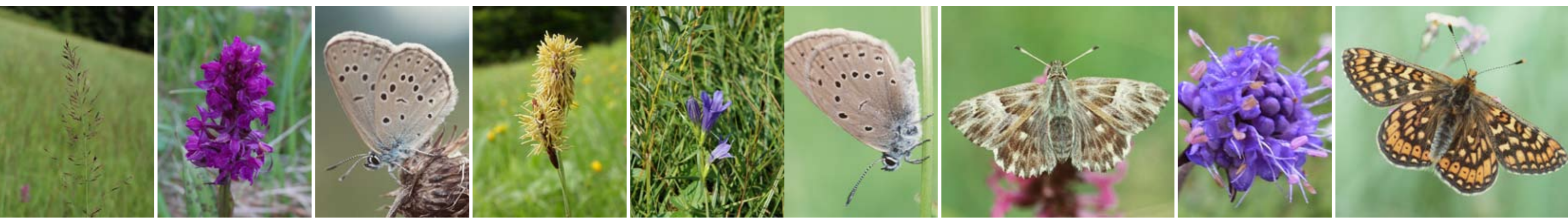
Pfeifengras Breitblatt Fingerknabenkräuter Lungenenzian-Ameisenbläuling Hirsensegge Lungenenzian Heller Wiesenknopf Wiesenknopf-Ameisenbläuling Teufelsabbiß Goldener Scheckenfalter