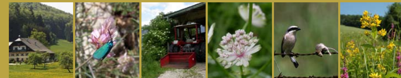
alter Bauernhof Ampfer-Grünwiderchen Große Sterndolde Neuntöter Gilbweiderich

Durch die gesamtbetriebliche Sichtweise und die intensive Beratung bietet der Naturschutzplan mehr Flexibilität als die Teilnahme mit Einzelflächen. Die betriebsspezifische Situation kann bei der Festlegung der Pflegeauflagen oder der Flächenauswahl verstärkt berücksichtigt werden. Beispielsweise können Düngeeinschränkungen gesamtbetrieblich abgestimmt oder Mähtermine nach dem Naturkalender individueller gestaltet werden. Das Modell der Mahdtermine nach der Blüte heimischer Pflanzen wird für Naturschutzplanbetriebe generell angeboten.