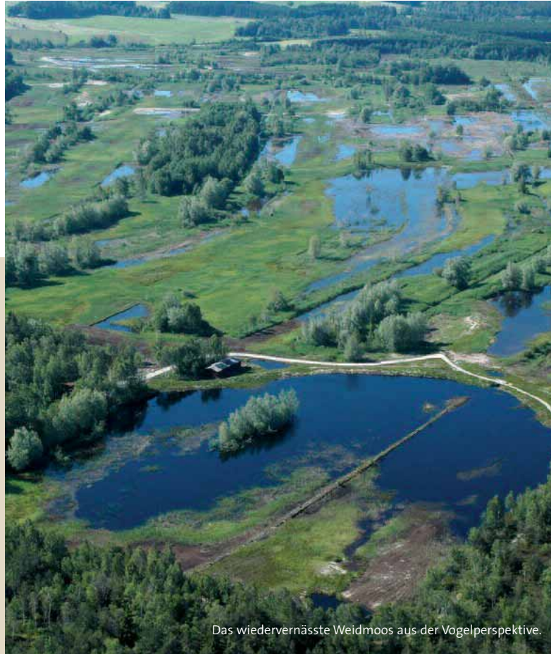
Das wiedervernässte Weidmoos aus der Vogelperspektive.

Diese Maßnahmen haben das Weidmoos langfristig als wichtiges Rückzugsgebiet für seltene Vogelarten gesichert.