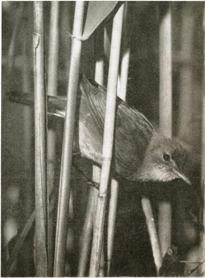
Umschlagbild: Teichrohrsänger