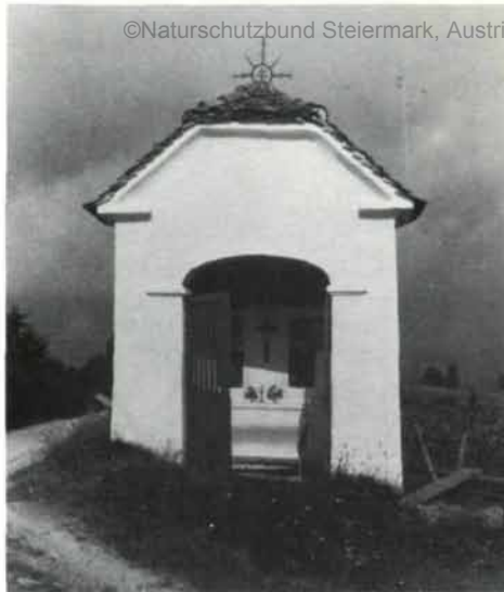
Viele Kulturdenkmäler konnten vor dem Verfall bewahrt werden ...