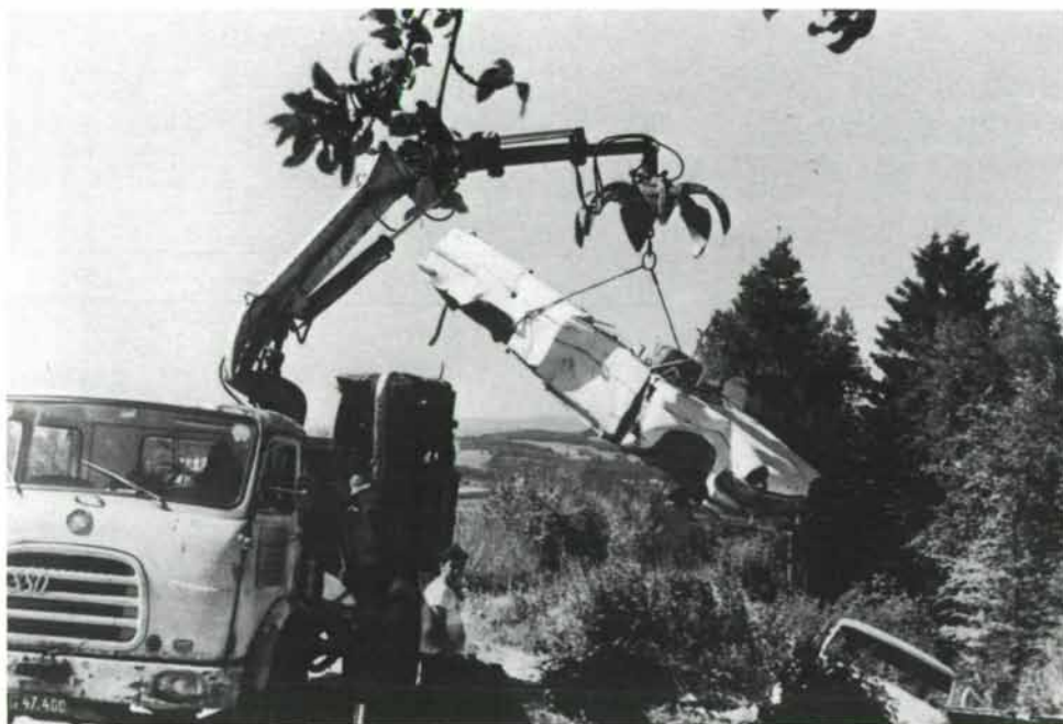
Ein gewohntes Bild: Schon mehr als 15.000 Wracks wurden von der Steiermärkischen Berg- und Naturwacht im Rahmen der Aktion „Saubere Steiermark“ beseitigt.