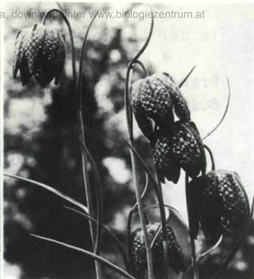
Naturdenkmale, geschützte Pflanzen und Blumen werden von den Berg- und Naturwächtern besonders überwacht. Unser Bild zeigt die seltene Schachblume ( Fritillaria meleagris ) – eine vollkommen geschützte Pflanze feuchter Wiesen.

Der Jahresbericht 1978 zeigt nüchtern die wesentlichen Leistungen der Steiermärkischen Berg- und Naturwacht und ihren Organisationsstand auf. Viele kleine Geschehnisse, die sich nicht in Zahlen ausdrücken lassen, die aber doch so wirksam sind, können nicht oder nur andeutungsweise dargelegt werden: