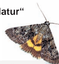
Das Gelbe Ordensband ( Catocala fulminea ), ein Bewohner des Kalksteinbruches