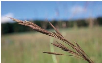
Aufrechte Trespe - Futterpflanze

Lage: Bierbaum/Safen, oststeir. Riedelland, Gemeinde Bad Blumau Größe: knapp 10 ha Betreuung: | naturschutzbund | Steiermark/ Regionalstelle Lafnitz