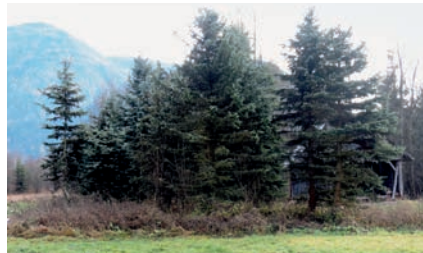
Neuanlage einer Scheckenfalter-Entwicklungsfläche: Vergrößerung des Habitats durch Rodung einer ehemaligen Christbaumkultur