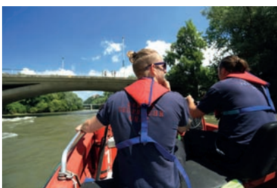
Wasserdienst der Grazer Feuerwehr

Die an die Gewässerlebensräume gebundenen Tiere brauchen eine nicht unterbrochene Ufervegetation im Stadtgebiet. Im Buch geben zahlreiche Fachbeiträge von Geologen, Zoologen, Botaniker usw. Aufschluss über die Einzigartigkeit dieses Lebensraumes. Auch spannende Einblicke in die Geschichte und das aktuelle pulsierende Leben an und mit der Mur werden gezeigt.