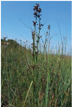
Schneidried ( Cladium mariscus ) - einziges Vorkommen in der Steiermark

mit den Pfeifengrasbeständen und den Kleinseggenrieden erhalten. Aufgrund der fehlenden Düngung bleibt die Wiese nährstoffarm und artenreich. Nach der Überwinterung leben die Raupen einzeln und nutzen ein breiteres Wirtspflanzenspektrum. Ein wichtiger Schritt ist die Habitatsausweitung. Nach Absprache mit den Eigentümervertretern der Firma ALWA bzw. der Vogelwarte wird ein Biotop-