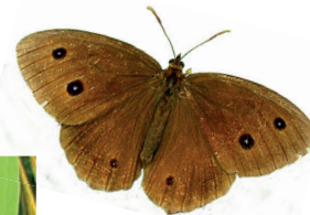
Blauäugiger Waldportier (Blaukernaue)

Gefährdung: Durch Intensivierung und Technisierung der Landwirtschaft, aber auch durch Nutzungsaufgabe stark in seinen Beständen bedroht.