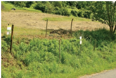
Sandhang: Ausgepflockte Osterluzeipflanzen - einzige Futterpflanzenart der Osterluzeifalter-Raupen.

Um Schmetterlingswiesen zu bewahren, ist regelmäßige Entbuschung notwendig. Dadurch wird die Sukzession aufgehalten und der wichtige Wiesencharakter erhalten. Auch im Katzengraben am Sandhang gab es mehrere intensive Gehölzrückschnitte von Rotem Hartriegel, Schwarzkiefer etc., ferner wurden die zum Austrieb von Wurzelschösslingen neigende Gewöhnliche Robinie aufwendig geringelt. Abgestimmt auf das Tagfalter- und ihrer Futterpflanzenvorkommen sind Mährhythmen einzuhalten. Verfilzungen von Wiesen durch zu späte Mahd