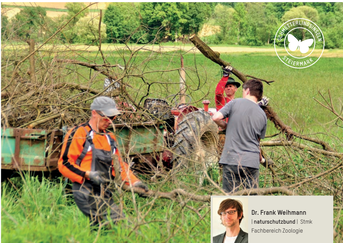
Hirschböckwiese: Gehölzrückschnitt gegen Verbuschung.