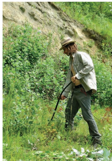
Sandhang: Neophytenbekämpfung - Entfernung der invasiven Goldrute.