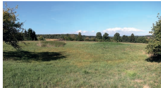
„Karl Schmetterlingsinsel“ befindet sich in unmittelbarer Nähe der 1000jährigen „Bierbaumer Eiche“.

Pflegemaßnahmen notwendig. „Die größeren Areale werden mit dem Traktor gemäht. Bei den kleinen unwegbaren Flächen kommen Motormäher und Sense zum Einsatz. Es wird auch für die Abführung des Mähgutes und Verwertung für Rinder und Pferde bei Bauern in der Umgebung gesorgt.