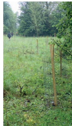
Hauenstein: Eichenpflanzung - Raupenfutterpflanze für das Gelbe Ordensband - ein Sponsor-Projekt einer Wiener Künstlergruppe vermittelt durch die | naturschutz | Bundesgeschäftsstelle in Salzburg.

Ohne dieses Netzwerk aus MitarbeiterInnen des | naturschutzbund | und allen Helferinnen und Helfern in den Bezirken der Steiermark wäre ein effektiver Schutz unserer zahlreichen Biotope nicht durchführbar.