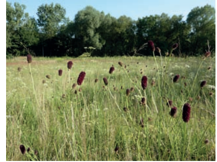
Ein wichtiges Landschaftselement ist die das Grundstück umfassende Hecke

Wichtigste Pflanze im Lebenszyklus dieser Tagfalter ist der Große Wiesenknopf ( Sanguisorba officinalis ). Er ist nicht nur Nektarquelle und Paarungsplatz für die adulten Tiere, sondern auch Ort für die Eiablage und Lebensraum der ersten Raupenstadien. Infolgedessen muss der richtige Mähtermin - nämlich im Spätsommer - gewählt werden. Die Jungraupen leben und ernähren sich ein paar Wochen von den dunkelroten Blüten. Auf der Wiese müssen Bauten einer speziellen Ameisenart - die Rotgelbe Knotenameise -