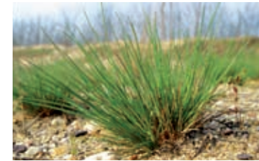
Das vom Aussterben bedrohte March- taler Silbergras kommt in Niederöster- reich nur an wenigen Standorten vor.

Nicht nur von regelmäßigen Überschwemmungen gepräg- te Landschaften sind in den March-Thaya Auen zu finden. Besondere Kleinode sind die Sandböden mit ihrer ganz speziellen Tier- und Pflanzenwelt. Diese Binnendünen ent- standen unmittelbar nach der letzten Eiszeit als mehrere Meter mächtige Flugsanddecken. In der Nähe der Flüsse lagerten sich grobkörnige silikatische Sande ab.