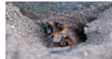
Hosenbienen graben lange Gänge in den sandigen Boden, in die sie ihre Eier ablegen.

Typisch für diese Sand- lebensräume ist das March- taler Silbergras. Dazu gesellen sich weitere sehr seltene Sandrasenarten, wie der Sand- Quendel oder der Frühlings- Spörgel. Aber auch in der Tierwelt gibt es einige Arten, die sich auf ein Leben unter den trocken-heißen Bedin- gungen der offenen Sandbö- den spezialisiert haben. Neben Spinnen, Heuschrecken und Käfern finden sich insbeson- dere unter den Grabwespen und Wildbienen einige Arten, die den lockeren Sand zur Anlage ihrer Nester nutzen.