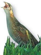
Der Wachtelkönig genießt wie auch der Seeadler den besonderen Schutz der europäischen Vogelschutz-Richtlinie.

Der stark gefährdete Wachtelkönig hat eines seiner wichtigsten niederösterreichischen Vorkommen in den March-Thaya-Auen. Vor allem die großflächige Wiesenlandschaft der Rabensburger Thaya-Auen bildet einen idealen Lebensraum für den seltenen Vogel, der in den zum Teil erst spät im Jahr gemähten Wiesen und Brachen brütet. Wer im Frühsommer abends unterwegs ist, kann das typisch knarrende Rufen der Männchen hören, das der Art zu ihrem lautmale-rischen wissenschaftlichen Namen Crex crex verholfen hat.