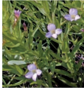
Das stark gefährdete Gnadenkraut ( Gratiola officinalis ) gilt als traditionelle Arzneipflanze.

Das Zusammenspiel der Dynamik der Flüsse und der menschlichen Nutzung prägt den Lebensraum der Brenndol- den-Überschwemmungswie- sen. Sie sind dort entstanden, wo der ursprüngliche Auwald gerodet wurde. Die sehr pro- duktiven Wiesen beherbergen eine auf die Flussniederungen Ostösterreichs beschränk- te Pflanzenwelt, die auf die jährlich stattfindenden Über- schwemmungen angewiesen ist. Die Frühjahrshochwässer bringen reichlich Nährstoffe, wobei die Pflanzen eine längere Überstauung ohne Probleme vertragen. Je nach Überschwemmungshäufigkeit werden die Wiesen ein- bis zweimal jährlich gemäht.