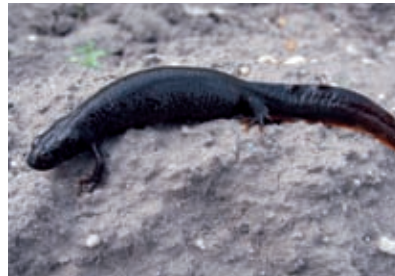
Der gefährdete Donaukammolch genießt durch die Fauna-Flora-Habitat-Richtlinie in allen EU-Ländern einen besonderen Schutzstatus.

In den Tümpeln und Teichen, Wiesen und Wäldern der March-Thaya-Auen leben zwölf verschiedene Amphibien-Arten. So auch die stark gefährdete Wechselkröte, die an ihrer auffälligen grün-weißen Zeichnung leicht zu erkennen ist, der seltene Donau-Kammolch, die Knoblauchkröte und die Rotbauchunke.