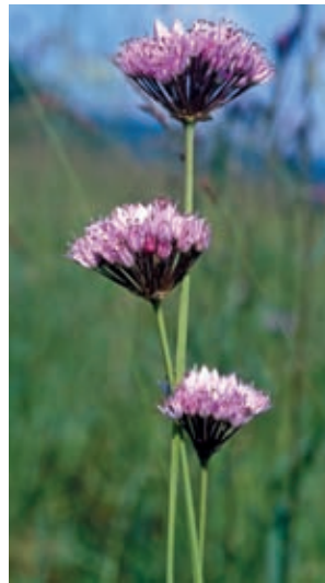
Der seltene Kanten-Lauch ( Allium angulosum ) gilt als Zeiger von wechselnden Grundwasserständen, der während des Sommers eine zeitweilige Austrocknung seiner Standorte erträgt.

Eine Reihe seltener Pflanzenarten charakterisiert diesen Feuch- wiesentyp. Das Gnadenkraut öffnet seine zarten, blassrosa bis weißen Blüten meist im Juni, gefolgt vom hellpurpur blühen- den Kantenlauch. Botanische Besonderheiten sind außerdem die namensgebende Brenn- dolde mit ihren lang gestielten Blütendolden, das violett-blau blühende Spieß-Helmkraut oder die Nickende Segge aus der Gruppe der Sauergräser.