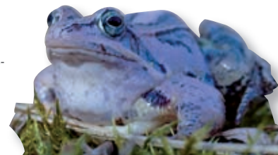
Der Moorfrosch mit der leuchtend blauen Paarungsfärbung der Männchen gehört zu den spektakulärsten Erscheinungen der heimischen Tierwelt.

Eine der faszinierendsten Lurch-Arten der Region ist wohl der Moorfrosch. Er ist dank der leuchtend blauen Paarungsfärbung der Männchen im Frühjahr eine der spektakulärsten Erscheinungen der heimischen Tierwelt. Die jährlich stattfindende Wanderung von und zu den Laichgewässern macht die gefährdeten Amphibien zu häufigen Opfern des Straßenverkehrs. Bei Hohenau schützt eine Leitanlage mit Untertunnelungen die über die Bundesstraße wandernden Tiere.