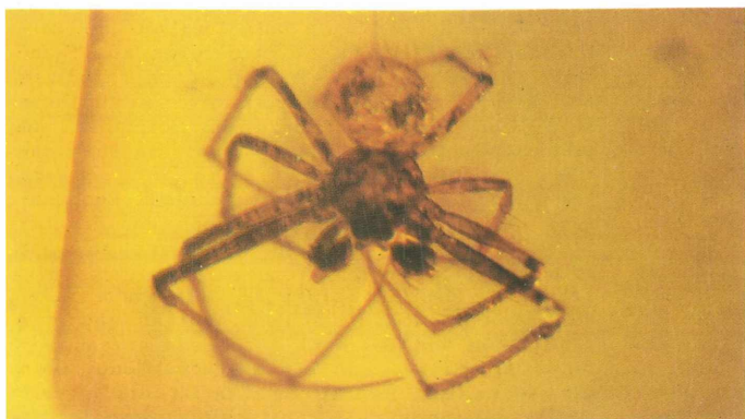
Abb. 1-4: Acrometa cristata PETRUNKEVITCH, 1942, \delta .

Zur Fauna (hier behandelt: Spinnen, Araneae): BARTHEL & HETZER (1982: 315) schreiben: "... dies sind meist nicht sessile Arten, sondern sogenannte "Jäger", die ohne Fangnetz etc. ihre Beute frei erjagen," ... "wie auch beim baltischen Bernstein." Aus meiner Er-