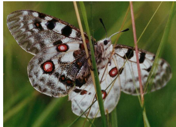
Abbildung 7: Unterseite des "Halbseitenzwitter" oder Gynander des roten Apollos.

"Die Determination des Geschlechts bei Schmetterlingen hat eine gewisse Ähnlichkeit (jedoch mit quasi umgekehrtem Vorzeichen) mit der des Menschen: Während beim Menschen Frauen Träger von zwei X-Chromosomen und Männer von einem X- und einem Y-Chromosom sind, sind bei den meisten Schmetterlingen die ♀♀ Träger eines längeren Z- und eines kürzeren W-Chromosoms, während die ♂♂ zwei Z-Chromosomen aufweisen.