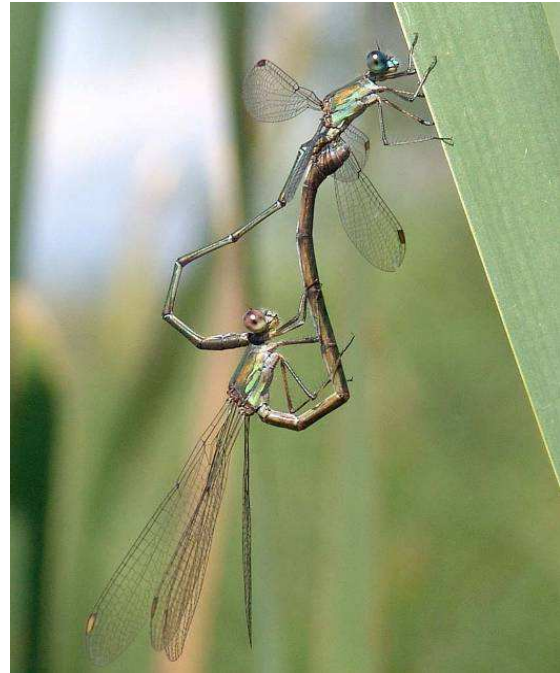
Abbildung 12: Die Weidenjungfer Lestes viridis (Vander Linden, 1825) ist an den hellen Flügelmalen (Pterostigmen – Spitze der Flügel) bei richtigem Lichteinfall (hier beim Weibchen, unten) gut zu erkennen. Bei oberflächlicher Betrachtung kann sie mit den vier weiteren in Salzburg vorkommenden Binsenjungfern allerdings leicht verwechselt werden. Die Gestalt der Hinterleibsanhänge erlaubt eine eindeutige Bestimmung.

tigen (Gesamtkörper seitlich und ventral, Kopf frontal und dorsal, Hinterleib dorsal, Hinterleibsanhänge, Flügel), bevor das Tier wieder freigelassen wird. Eine eindeutige Bestimmung ist jedoch oft nur anhand eines physischen Belegs möglich! Zum Fangen der Tiere sind Netz und etwas Geduld erforderlich!