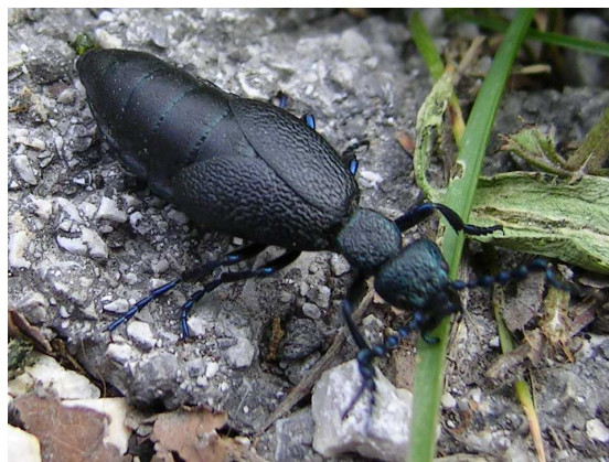
Abbildung 4: Auch die Männchen von Meloe proscarabaeus sind hungrig nach der Winterruhe - aber sie werden vom Fressen nicht dicker!

Wie lange diese idealen Bedingungen an- halten werden, ist ungewiss. Aus dem Stadtgebiet ist bis 2008 nur ein einziger Fund, 70 alter Funde von Meloe proscar- baeus bekannt: Riedenburg 23. 3.1941, aus der Kartei Hermann Frieb. Im ganzen Land Salzburg gibt es nur einen einzigen weiteren Nachweis: Weißenbach bei Strobl, 18.04.1972, leg., det. et coll. Man- fred Bernhard (Geiser 2001).