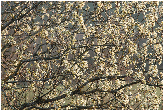
Abbildung 1: Blühende Salweide im Abendlicht.

Liebe Mitglieder! Freunde der entomologischen Arbeitsgemeinschaft!