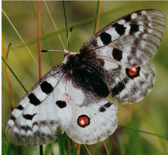
Abbildung 6: Oberseite des "Halbseitenzwitter" oder Gynander des roten Apollos. Deutlich ist die dunklere rechte männliche Seite von der linken zu unterscheiden.

Mit den Worten, "das ist ja ein wunderschöner Apollo-Zwitter, so etwas habe ich selbst noch nie gefunden", war das Rätsel gelöst. Jetzt erkannte auch ich, dass die linke Flügelseite ein wunderschönes Männchen und die rechte Seite ein ebenso schön gezeichnetes Weibchen waren.