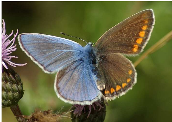
Abbildung 8: Gynander ("Halbseitenzwitter") von Polyommatus icarus (Rottemburg, 1775): Deutlich sind die linke männliche (blaue) und die rechte weibliche (braune) Seite zu erkennen.

darin enthaltenen Chromosomen betreffende) Untersuchung feststellbar.