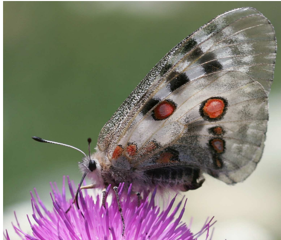
Abbildung 5: Der rote Apollo ( Parnassius apollo ). Nach dem Washingtoner Artenschutzabkommen, Appendix II gilt er als weltweit geschützt und ist die einzige weltweit geschützte nichttropische Schmetterlingsart (Stand 1990). Weiters wird diese Art auch im Anhang II der Berner Konvention gelistet, ist auch einer der wenigen Schmetterlingsarten im Anhang IV der Fauna-Flora-Habitat-Richtlinie und somit als streng geschützt ausgewiesen.

Es war ein wunderschöner Tag, der 26.07.2001, und ich war voller Freude in meinen Gedanken, was ich an diesem Tag unternehmen werde. Wie wäre es mit einem Ausflug zum Seewaldsee?