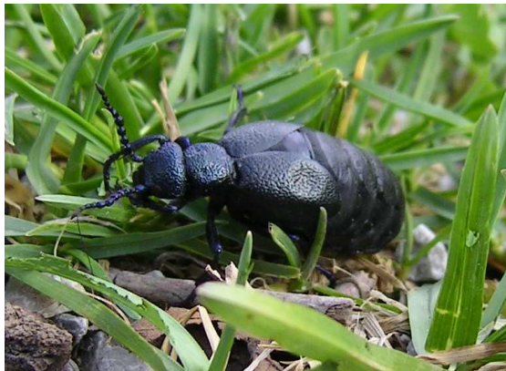
Abbildung 2: Ein Weibchen von Meloe proscarabaeus beim Reifungsfraß, mit bereits deutlich vergrößertem Abdomen.

Meloe proscarabaeus überwintert im Boden, die Käfer klettern an den ersten warmen Frühlingstagen (ab Mitte März) ins Freie und widmen sich zunächst dem Reifungsfraß. Sie fressen verschiedene Gefäßpflanzen. Bei den ♀ erfolgt in dieser Zeit die Eireifung, wodurch sich deren Hinterleib stark vergrößert. Die ♀ werden bis zu 45 mm lang. Die ♂ sehen aus wie junge Weibchen, aber an den geknickten Fühlern kann man sie gut als ♂ identifizieren.