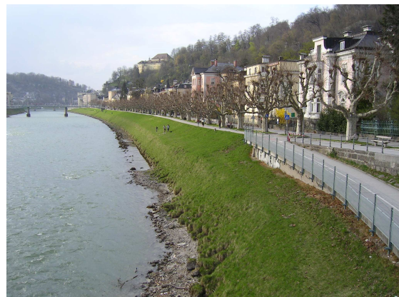
Abbildung 3: Der Giselakai in Salzburg - Ort der Massenentwicklung von Meloe proscarabaeus .

Wenn ein Triungulus in einem Wirtsnest gelandet ist, ernährt er sich von den Nahrungsvorräten und der Brut der Wirtsbienen. Der Triungulus häutet sich zu einer engerlingförmigen Larve, die sich nach mehreren weiteren Häutungen verpuppt. Die Imagines schlüpfen im Herbst, verbleiben aber bis zum Frühjahr im Boden. (Näheres zur Biologie in: Lückmann & Niehuis 2009).