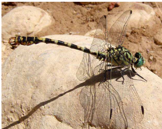
Abbildung 11: Das Männchen der Kleinen Zangenlibelle Onychogomphus forcipatus (Linné, 1758) ist an den kräftigen Hinterleibsanhängen gut zu erkennen. Bei oberflächlicher Betrachtung kann diese Art mit anderen Flussjungfern trotzdem leicht verwechselt werden. Eine Aufnahme kann in den meisten Fällen alle Zweifel beseitigen!

Unser Ziel wäre es, für alle Quadranten Salzburgs Nachweise von mindestens 5 bis 10 Arten zu erbringen!