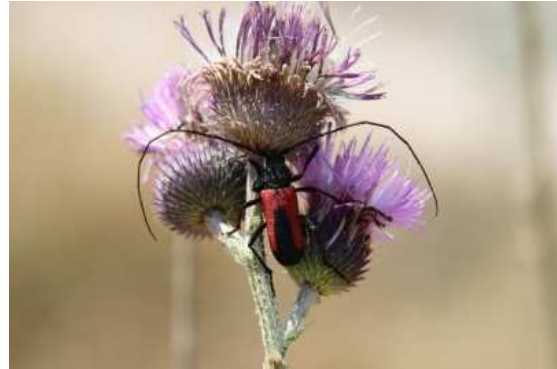
Abbildung 21: Purpuricenus kaehleri

betreten dürfen. Seit kurzem genießt es den Status eines Nationalparks.