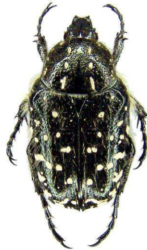
Abbildung 2: Um keinen Zweifel aufkommen zu lassen, wurde dieses Exemplar von Oxythyrea funesta als Beleg aus dem Lungau (9.06.2009, Saumoos / St. Michael) vom Autor mitgenommen!