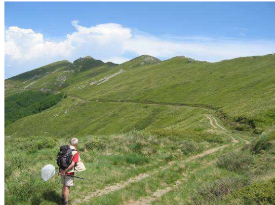
Abbildung 22: Belasitza Nationalpark: Fußmarsch nach Griechenland

Nach ca. 6 Stunden Fußmarsch haben wir tatsächlich die griechische Grenze erreicht und die uns von Victor versprochenen Bockkäfer, Agapanthia kirbyi und Dorcadion borisii , gefunden.