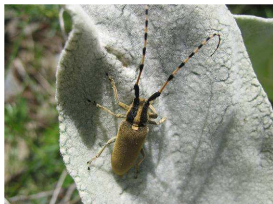
Abbildung 23: Agapanthia kirbyi auf der Futterpflanze seiner Larven