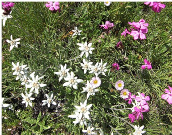
Abbildung 4: Edelweiß ( Leontopodium alpinum ) und Karthäusernelke ( Dianthus carthusianorum )

Im Rahmen einer Kartierungsexkursion der Salzburger Botanischen Arbeitsgemeinschaft (SABOTAG), an der auch Interessierte aus anderen Fachgebieten teilnahmen, wurde die Tour am 26.7.2009 zum ersten Mal begangen, eine Woche später auf der Suche nach Isophya brevicauda ein zweites Mal.