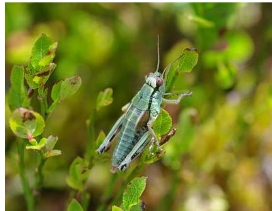
Abbildung 8: Kärntner Gebirgsschrecke ( Miramella carinthiaca )

Bereits der Aufstieg im Wald bietet mit dem Kleinen Zweiblatt ( Listera cordata ) einen sehr interessanten, wenngleich auch eher unscheinbaren Fund. Neben anderen Mohrenfaltern fliegt auf den Magerweiden im oberen Teil Erebia claudina , die nur im Grenzgebiet von Salzburg, Kärnten und der Steiermark vorkommt und somit hier endemisch ist. Besonders reichhaltig sind aber schließlich die von der Schrovinscharte nach Süden abfallenden, sehr steilen, ehemaligen Bergmähder.