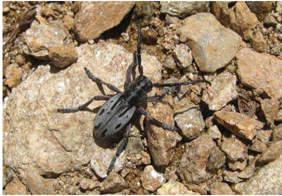
Abbildung 24: Dorcadion borisii im Belasitza Nationalpark

Am vorletzten Tag führt uns der Weg noch zum Struma-Ufer im Bereich Kresna gorge. Nur für kurze Zeit können wir ein letztes Mal die Vielfalt der Insekten- und Pflanzenwelt in diesem Bereich Bulgariens genießen. Unsere Reise war, vor allen dank der fachkundigen und immer gut gelaunten Führung von Victor, ein tolles Erlebnis.