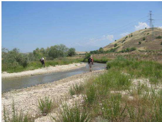
Abbildung 20: Seitenarm des Melnishka-Flusses. Lebensraum von Cicindela fischeri und Cicindela hybrida .

Aufgrund der Mittagshitze weisen diese beiden Sandlaufkäferarten ( C. fischeri und C. hybrida ) eine sehr große Fluchtdistanz auf, sodass es uns nicht gelingt, Fotos zu erhalten.