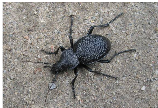
Abbildung 15: Carabidae: Procerus gigas

Das Kloster wurde im 10. Jht. gegründet und erhielt sein heutiges Aussehen zwischen 1816 und 1847 durch bulgarische Handwerksmeister. Beeindruckend auch die Schnitzkunst, die im Museum gezeigt wird, vor allem das Holzkreuz des Mönches Raffael. Es verwundert uns nicht, dass dieses Kloster als Weltkulturerbe aufgenommen wurde.