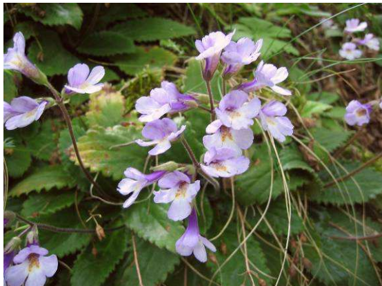
Abbildung 17: Eine endemische Pflanze der Rhodopen, Haberlea rhodopensis

Neben zahlreichen interessanten Käfern (verschiedene Buprestiden- und Bockkäferarten an den alten Weiden und Pappeln, Chlaenius - und mehrere Bembidion -Arten bei den Schotterbänken) finden wir auch eine Würfelnatter. Um schneller flüchten zu können, speit sie ihre Mahlzeit aus – einen jungen Fisch.