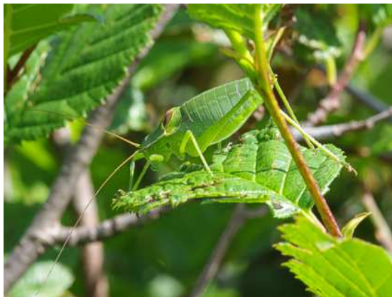
Abbildung 7: Kurzschwänzige Plumpschrecke ( Isophya brevicauda )

Der Rückweg erfolgt auf demselben Weg. Alternativ besteht die Möglichkeit, auf einem "schwarzen" alpinen Steig nach längerer Querung der sehr steilen Hänge in rund 2 Stunden zum Rotgüldensee abzustiegen und von dort auf einem Wanderweg oder auf der Zufahrtsstraße in rund einer 3/4 Stunde zum unteren Parkplatz zurück zu kehren (Schwindelfreiheit und Trittsicherheit vorausgesetzt, bei Nässe sehr gefährlich!).