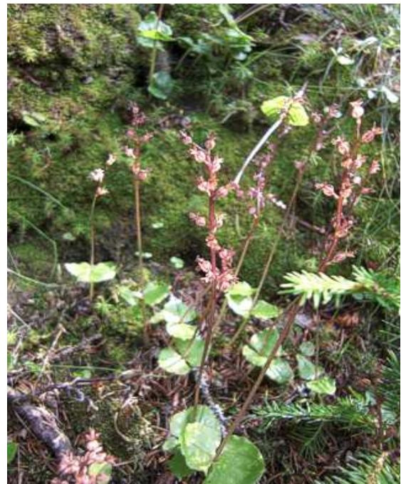
Abbildung 5: Kleines Zweiblatt ( Listera cordata )

den Ort Muhr hindurch, bis die Weiterfahrt durch einen Schranken versperrt ist. Wer beabsichtigt, die Rückwanderung über den Rotgüldensee vorzunehmen, sollte das Auto hier auf dem Parkplatz stehen lassen. Anderenfalls geht es rechts hinauf weiter, wobei sich der automatische Schranken durch den Einwurf von 3.- Euro öffnet und die schmale Straße noch rund 3,5 km weiter bis zu einem größeren Parkplatz nahe der Muritzenalm führt.