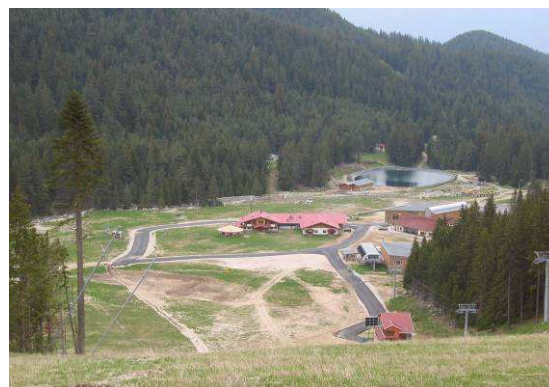
Abbildung 11: Blick von der „Alberto Tomba“ Piste auf das zugehörige Ressort

Unsere erste Exkursion führt uns über das bekannte Schidorf „Bansko“, welches offensichtlich gerade einen enormen Bauboom erlebt, in den „Pirin Nationalpark“.