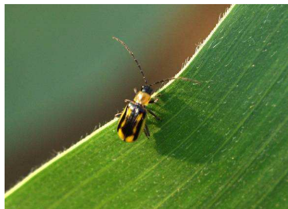
Abbildung 1: Maiswurzelbohrer

Dass der Einzelfund in Wals-Siezenheim keine Eintagsfliege (eigentlich "Eintagskäfer") ist, beweist ein weiterer Fund in Freilassing (Deutschland, Bayern). Als Koleopterologe kann man nichts weiter tun, als eine weitere Art zur Salzburger Käferfaunistik hinzufügen, auch wenn es einen diesmal ganz und gar nicht freut!