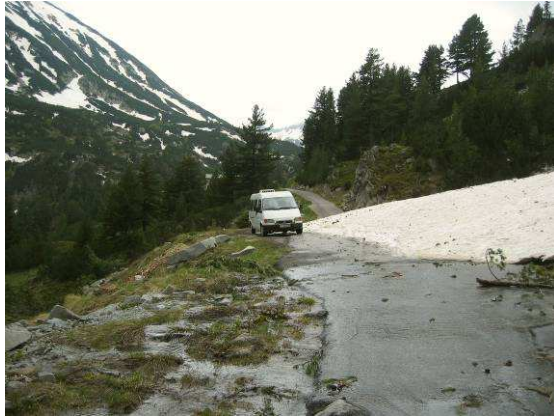
Abbildung 12: Im Pirin Nationalpark. Ausläufer von Lawinen bedecken anfangs Juni noch die Strasse

wiesen und eine Lawine versperrt beinahe die Strasse.