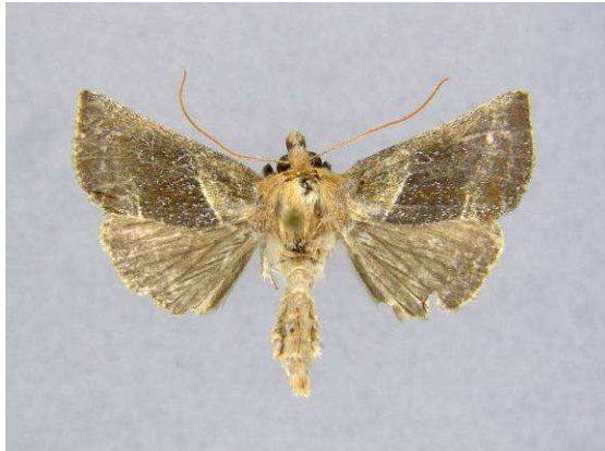
Abbildung 25: Euchalcia emichi

Während einer Urlaubswoche auf der griechischen Insel Kos unternahm ich auch einen Ausflug auf die Vulkaninsel Nisyros. In der kleinen Ortschaft Nikiá, in 430 m Höhe am oberen Ende der Caldera des Vulkans gelegen, fand ich am 1. Juni 2009 an einer Hausmauer zwei Exemplare einer mir vorerst unbekanntes Plusiinae, die sich dann dank der Bestimmungshilfe von Kollegen Gottfried Behounek als Euchalcia emichi Rogh. erwiesen. Dieser Fund bedeutet den 2. Nachweis der Noctuide für Griechenland und damit auch für Europa.