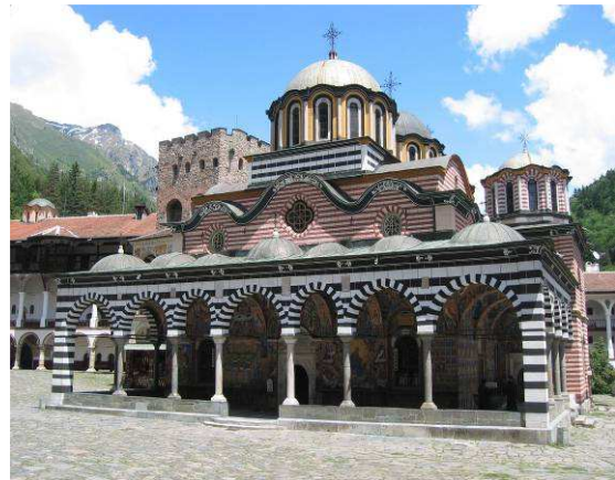
Abbildung 14: Rila Kloster

Ein besonderes Erlebnis ist der Besuch des Rila Klosters. Bereits der Weg dorthin beschert uns einige interessante Bockkäfer, z.B. Vadonia dojranensis zahlreich auf Euphorbia , Morimus funereus in Hochzeitslaune auf Pappelstämmen sowie verschiedene Wanzenarten. Beim Rila Kloster angekommen, beeindruckt uns seine Architektur und die umfangreichen Fresken im Außenbereich.