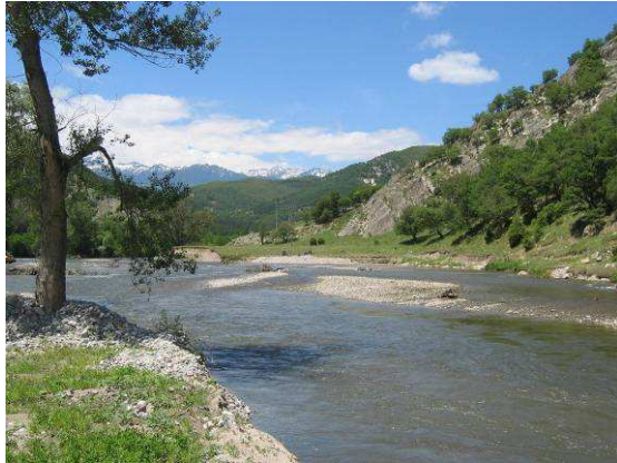
Abbildung 16: Mestra Ufer

Wir verlassen unser Biohotel und begeben uns zu den Trigradbergen, welche Teil der westlichen Rhodopen sind. Am Weg dort hin machen wir an den Ufern der Mestra halt.