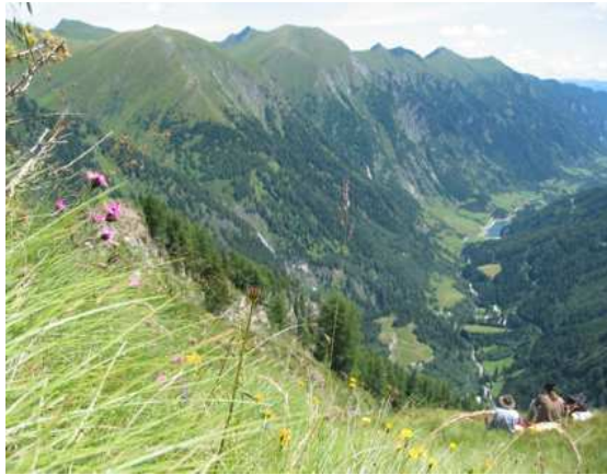
Abbildung 3: Blick von der Schrovinscharte ins Murtal

höchst interessantes Gebiet, das während der letzten Eiszeit zum Teil unvergletschert geblieben und von silikatischen wie karbonatischen Gesteinen gekennzeichnet ist. Dadurch finden sich hier eine Reihe endemischer Tier- und Pflanzenarten.