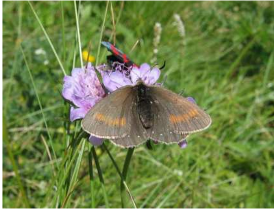
Abbildung 6: Erebia claudina , gemeinsam mit Zygaena filipendulae an Scabiosa lucida saugend

heiden und ausgedehnten Rhododendron-Beständen. Schroffe Gipfel begrenzen den Blick nach Süden, der Weg führt aber relativ flach in einer großen Kurve an den nordseitigen Fuß dieser Gipfel, von wo es die letzten 30-40 Höhenmeter sehr steil zur Schrovinscharte hinaufgeht.