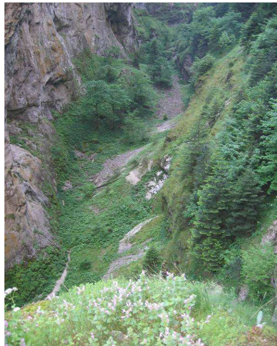
Abbildung 18: Schlucht am Weg nach Trigrad. Heimat von Procerus sommeri

Die letzten Tage wollen wir in den wärmeren südwestlichen Grenzgebieten Bulgariens in der Umgebung der Stadt Melnik verbringen. Diese schöne Stadt, Ausgangspunkt für die Exkursionen der folgenden Tage, steht aufgrund der besonderen Architektur der Häuser unter Denkmalschutz.