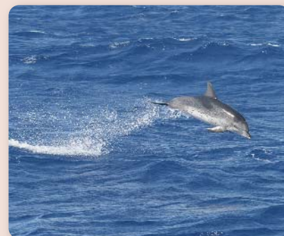
In Seen brauchen „entsorgte“ Kippen ca. 15 Jahre um zu zerfallen - im Meerwasser wahrscheinlich noch länger.

mare-mundi und NATURSCHUTZBUND Österreich appellieren deshalb an alle Raucher, ihre Zigarettenreste nur in dafür vorgesehene Behälter zu entsorgen. „Fehlende Aschenbecher sind