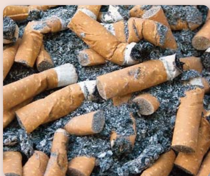
Bis zu 4.000 schädliche Stoffe machen eine Zigarettenkippe zum Sondermüllproblem.

Bis zu 4.000 schädliche Stoffe sind in einer Zigarettenkippe zu finden. Sie machen die kleinen Zigarettenreste zu Sondermüll, der keineswegs harmlos ist. So kann eine einzige Kippe mit ihrem Mix aus Toxinen zwischen 40 und 60 Liter sauberes Grundwasser