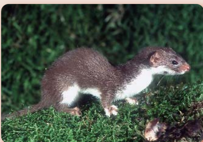
Auch das Mauswiesel nutzt den Lebensraum Hecke.

Hecken zählen neben Fluss- und Bachläufen zu den wichtigsten vernetzenden Strukturelementen unserer Landschaft: Sie sind bandförmige Lebensräume für insgesamt bis zu 800 verschiedene Pflanzen- und 7.000 Tierarten. Für viele von ihnen sind Hecken lebensnot-