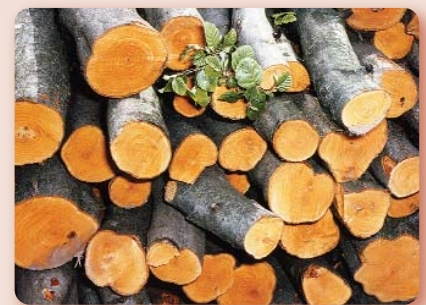
Die kleinräumige Nutzung von Hecken fördert den Strukturreichtum dieses Lebensraumes.

Wer keinen Platz für eine große Hecke hat, kann auch nur einzelne Sträucher oder Bäume im Garten pflanzen. Auch auf einem Balkon muss man auf eine „Mini-Hecke“ nicht verzichten: In größeren Kübeln gedeihen etliche Sträucher ebenso gut. Man sollte sie dann allerdings öfter schneiden um ihr Größtenwachstum zu reduzieren.