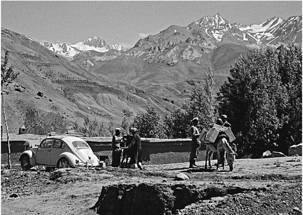
Abbildung 2. Vor dem Aufstieg in das Gebirge musste die Ausrüstung vom „VW-Käfer“ auf Packtiere umgeladen werden.

Ahnung des Erlebten: „Sarobi, mein Stützpunkt am Kabulfluss – Über den Lataband-Pass – Das also ist Kabul – Zwischen Mühlsteinen“, (Kapitel 6): „Nach Kandahar – Vom Abenteuer einer Busreise – Der Hadji von Shaikhabad – Auf Lord Roberts’ Spur“, (Kapitel 7): „Im Zentrum der Pashtunen – Bei den Ruinen von Lashkar Gah – Leuchtnacht am Helmandfluss – Am Arghandab-Damm“, (Kapitel 8): „Eine Höllenfahrt mit der „Afghan Mail“ – Mit dem Fahrrad durch die Steppe von Mukur“, (Kapitel 9): „Reise nach Faizabad – Durch das Kokchatal – Beim Gouverneur von Faizabad – Von Bajonetten bedroht – Die Opiumbauern von Jurm“, (Kapitel 10): „Aufstieg zur Shiva-Hochebene – Bei den Karakulzüchtern – Das Gepäckpferd stürzt ab – Unser Feind der Hunger“, (Kapitel 11): „In der Gluthitze von Khanabad – Per Anhalter nach Süden“, (Kapitel 12): „Nach Bamian und Band-i-Amir – Im Tal der Buddhas – Das Wunder der Königseen“ (Band-i-Amir).