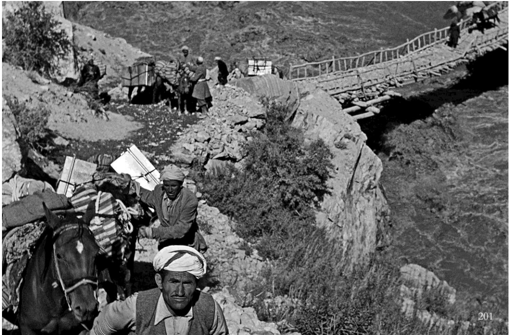
Abbildung 3. Teil der Karawane der „Wakhan-Expedition“ von 1971. Das Foto lässt Mühen und Gefahren erahnen, die alle Teilnehmer auf sich nehmen.