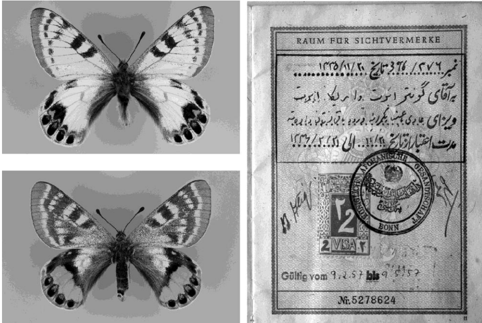
Abbildung 1. Die Wiederentdeckung des „Traumfalters“ Parnassius autocrator in den 1930er Jahren durch Hans Kotzsch war eine starke Motivation für den Buchautor, sich in das Abenteuer Afghanistan zu stürzen. – Alle Fotos: G. Ebert.

Diese beiden Kapitel zeichnen Eberts damaligen Weg minutiös nach, und es ist eine einmalige Gelegenheit, aus erster Hand zu erfahren, wie es zu dem Abenteuer kam. Meist treten bei Reise- und Expeditionsschilderungen diese Informationen im Licht der eigentlichen Unternehmung in den Hintergrund. Zu Unrecht, wie ich meine, denn auch heute noch geben sie Anregung, wie man eine kühne Idee umsetzen kann. Damit sie eben nicht eine bloße „Idee“ bleibt.