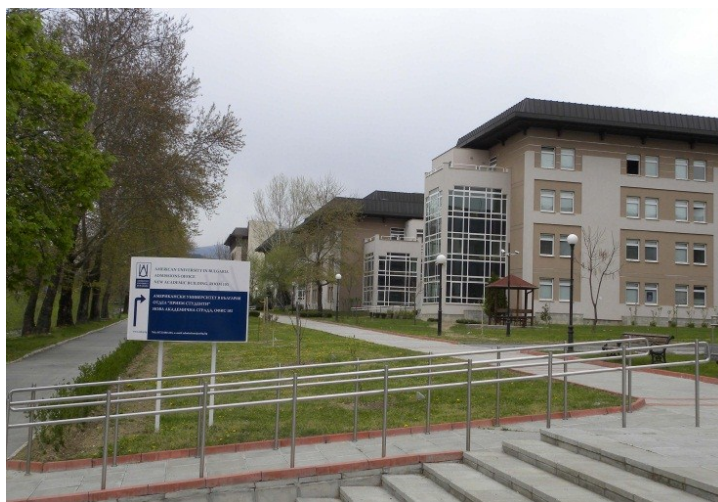
Blagoevgrad, hostels of the American University in Bulgaria.

The university hostels Skaptopara 3 and Skaptopara 2 on the campus are available for Congress attendants and accompanying persons, and provide very good and affordable accommodation with single, double and triple rooms, all with private bathrooms. Skaptopara 3 is just a bit newer and better than Skaptopara 2, which is also reflected in the prices. In total there are 77 double rooms and 100 triple rooms plus 23 apartments. Those who prefer can stay in a hotel in town (see www.ecl18.eu ), although the differences in quality will be small compared to the University accommodation.