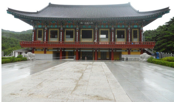
One of the buildings in the Donghwasu Temple complex in the mountains surrounding Daegu.

Some of the SEL members took time for collecting during and after the congress and perhaps we shall hear about their findings at the SEL congress in Bulgaria next year.