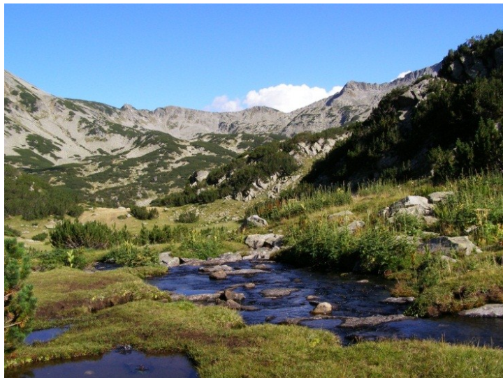
Pirin Mountains, subalpine zone.

semimediterranean and arid landscapes to evergreen, deciduous and coniferous forests and subalpine meadows. Two rivers are passing Blagoevgrad – Struma South Struma Valley, which is a big river and Bistritza with springs high in the Rila Mountain. In general nature there is well preserved, Rila and Pirin Mountains are National Parks: Pirin National Park , Rila National Park with several natural reserves, most of the other neighbouring territories are NATURA 2000 sites and Prime Butterfly Areas www.nmnh.com/butterfly_areas_bg which is evidence for their high biodiversity and well preserved natural habitats.