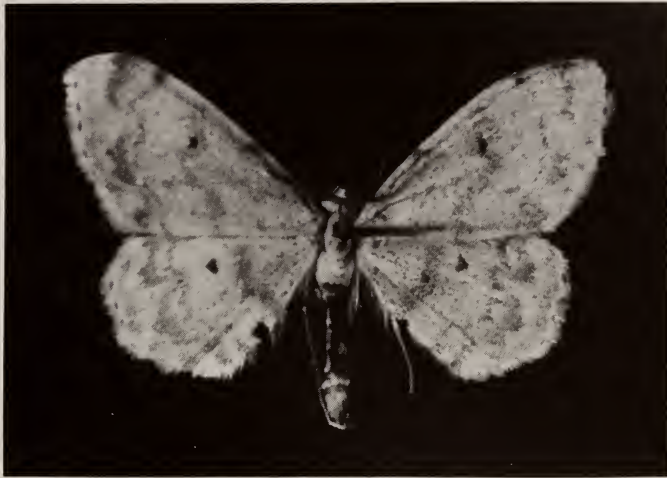
Abb. 1. Scopula agutsaensis sp. n. Holotyp ♂. 4 ×

BESCHREIBUNG. Männchen (Abb. 1). Vorderflügelänge 11–12 mm. Der Kopf dunkelbraun, dessen Scheitel und Rücken jedoch ockergelb. Die Palpen lang und flach, unten und seitlich mit eingemischten weisslichen Schuppen. Die Länge der Palpen gleich dem Augendurchmesser. Die Fühler ockergelb, Glieder schwach gezähnt, mit je zwei Paaren von Wimpern. Thorax und Abdomen ockergelb. Die Hintertibien leicht verdickt, mit Haarpinseln, ohne Sporen. Die Länge der Hintertarsen gleich der Länge der Hintertibien. Die Flügel oben und unterseits goldglänzend ockergelb mit Beimischung von zerstreuten rußig braunen Schuppen. Die Fransen ockergelb, an den Adern weisslich, in der vorderen Flügelhälfte mit dunklen Strichen längs dem Aussenrande. Die Flügelzeichnung braun, an den Vorderflügeln bestehend aus einer antemedianen Querlinie, an der Costa durch einen Flecken (Costalfleck) angedeutet, sonst kaum erkennbar einer medianen Linie in Form eines unscharfen, schmalen Bandes einer postmedianen Linie in Form einer scharfen, leicht gewellten Linie mit Costalfleck und distal davon mit einem an zwei Stellen unterbrochenem Schatten; einer schwachen Subterminallinie längs dem Aussenrand (Termen); an den Hinterflügeln aus einer medianen Linie, einer postmedianen Linie mit Schatten und einer Subterminallinie wie an den Vorderflügeln; ein deutlicher Diskalpunkt auf allen Flügeln.