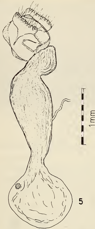
ABB. 5. — ♀-Genitalien : Agriphila tolli pelsonius ssp. nova, Paratypus, Fundort : Ungarn, Kaposvár, 24.VIII.1967. leg. NATTÁN, Gen.-präp. FAZEKAS, Nr. 1805. in coll. Janus Pannonius Mus., H-Pécs.