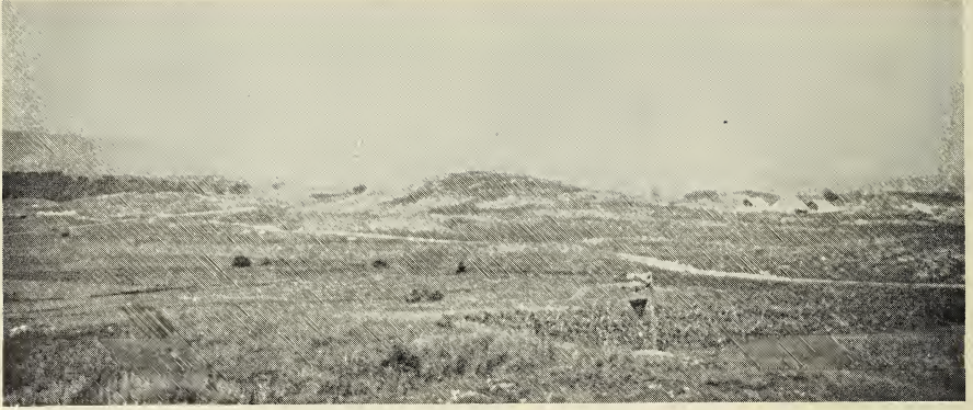
Terra typica : Öskü, Steppe, 200 m.