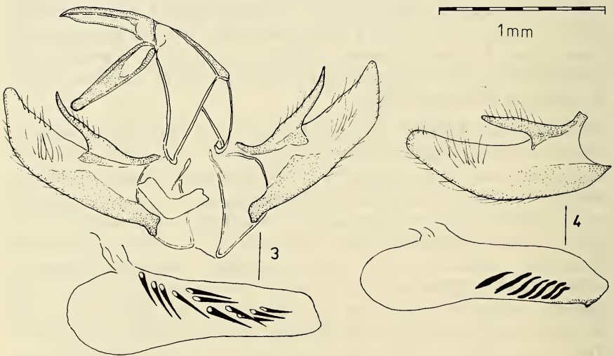
ABB. 3-4. – ♂-Genitalia: Agriphila tolli pelsonius ssp. nova, Holotypus, Gen.-präp. FAZEKAS, Nr. 1765. (3). ♂-Genitalia (Valva und Aedoeagus): Agriphila geniculea HAWOERTH, Ungarn, Bakony-Gebirge, Széki-erdő, 10.IX.1977. leg. SZABÓKY, Gen.-präp. FAZEKAS, Nr. 1793. (4).