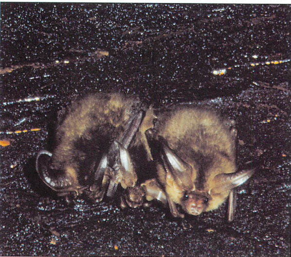
Abb. 4. Zwei adulte Graue Langohren, dazwischen - größtenteils verdeckt - vermutlich ein Jungtier.

Schließlich ist auch auszuschließen, daß es sich um ein Männchenquartier handelt. Dies geht zweifelsfrei daraus hervor, daß nur ganz selten einmal ein Langohr übertagt.