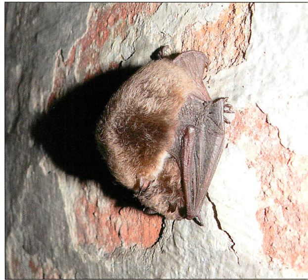
Abb. 7. Zum Vergleich: Paarungshaltung bei einem hinterher handkontrollierten Pärchen der Wasserfledermäuse ( Myotis daubentonii ) in den Gewölben der ehemaligen Ostquellbrauerei in Frankfurt/Oder. Aufn.: Dr. J. HAENSEL, 2.X.2007

vom Boden auf und verzehrte sie an Ort und Stelle!