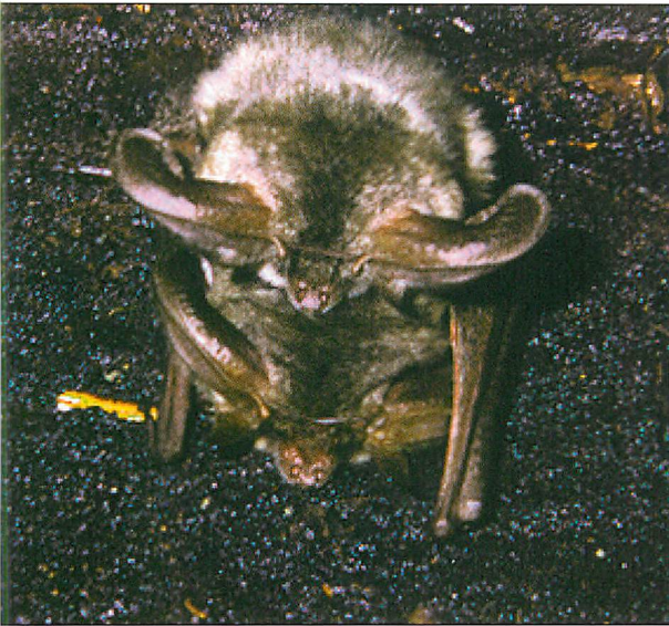
Abb. 6. Kopulation eines anderen Paares der Grauen Langohren in gleicher Haltung am gleichen Ort. Erläuterungen wie zu Abb. 5.