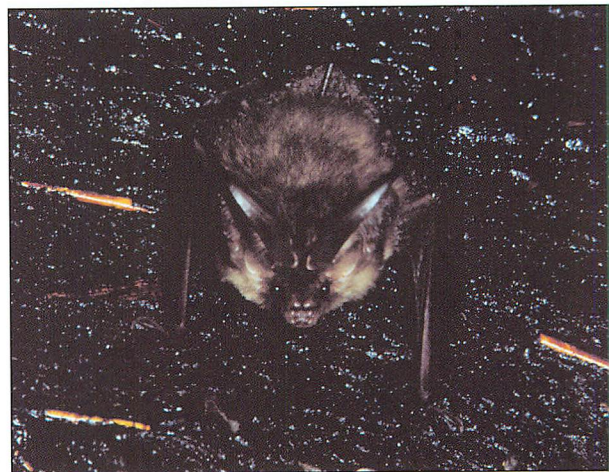
Abb. 3. Braunes Langohr in der Räucherkammer von Pevestorf. Beachte die intensive Braunfärbung sowie die langen Daumen und Daumenkrallen.

Frühjahrs- (von Februar bis April, gelegentlich auch später) und Herbstmonaten (von August/September bis November, gelegentlich noch später) besucht (vgl. Tab. 1). Des öfteren kommt es in den Besuchsfrequenzen zu kürzeren oder längeren Pausen, wofür Wind- und Niederschlagsverhältnisse nur einen der Gründe darstellen. Auch die Belegung mit