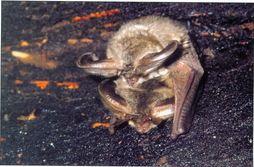
Abb. 5. Paarung der Grauen Langohren in der Räucherammer Pevestorf. Das ♂ hat das ♀ vollkommen umfaßt. Beachte die parallel nebeneinander liegenden Unterarme der beiden Partner sowie die typische Rückenkrümmung seitens des ♂.

Obwohl in meiner alten Räucherammer durch die Langohren über viele Jahre hinweg kein Nahrungserwerb festgestellt werden konnte (s. o.), und auch keine eingetragene Nahrung (Tag- und Nachtschmetterlinge) verzehrt wurden, machte ich einmal eine sehr bemerkenswerte Beobachtung: Am 22.XI.1994 sammelte ein Langohr spätabends vertrocknete tote Hornissen, die ich dort hingelegt hatte,