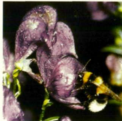
Abb. 11: Blauer Eisenhut mit Gartenhummel ( Bombus hortorum ).