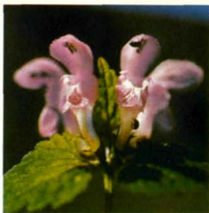
Abb. 9: Taubnesselblüten von vorne und schräg von unten eingesehen, mit den Antherengruppen unter der gewölbten Oberlippe. Bei der rechten vorderen Blüte sieht man einen kleinen Käfer ( Meligethes ) von der Seite her an den Antheren (pollenfressend!).

chenden Tagfalter ist z. B. die Karthäusernelke ( Dianthus carthusianorum ) eine rote Blume. Eigentlich handelt es sich um eine Mischfarbe, denn das Rot der Nelke enthält noch eine bedeutende Blaukomponente.