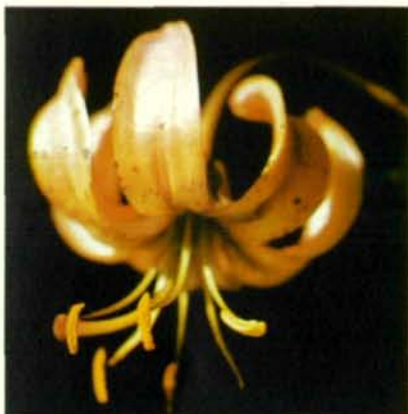
Abb. 7: Türkenbund-Einzelblüte: in der Mitte der Kronblätter erkennt man den Beginn der Nektarrinne; beachte besonders die nach der Seite abstehenden Staubblätter (Filamente biegen sich um, Antheren pendeln) und die Stellung der Narbe (kopfig) am dicken, gebogenen Griffel.

nen wegen des reichen Blütenstaubes besuchte rote Klatschmohn ( Papaver rhoeas ) zu widersprechen. Nur durch das Experiment konnte festgestellt werden, daß der Klatschmohn für die Biene nicht rot, sondern ultraviolett erscheint. Mohnblütenblätter reflektieren nämlich auch das kurzwellige Licht, für das wiederum wir keine Lichtempfindung haben. Für die Honigbiene ist eine Blüte nur dann weiß, wenn diese auch Ultraviolett reflektiert. Fehlt das kurzwellige Licht, weil es von den Blütenblättern absorbiert wird, dann erscheinen die uns weißen Blüten der Biene nicht mehr weiß, sondern in der Gegenfarbe zum Ultraviolett, nämlich blaugrün. Mit anderen Worten, wenn eine Honigbiene über eine Wiese mit blühenden Gänseblümchen oder Narzissen fliegt, dann leuchten ihr aus einem mehr oder