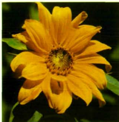
Abb. 2b: Helianthus tuberosus (Topinambur, „Erdbirne“), die Sonnen„blume“ als Beispiel für „Blume“ als Blütenstand (Körbchen).

auskeimende Pollen dringt bis zur Fruchtknotenhöhe vor und bringt die Geschlechtszellen zu der, oder den eingeschlossenen Eizellen. Blumenbesuchende Insekten sind also Bestäubungsvermittler. Aus dieser Tatsache allein wird schon das Auftreten von Blumen verständlich. Besonders einprägsam wird dies durch einen Vergleich von Insektenblumen mit den windblütigen Pflanzen (Windblütler = Anemogamen); bei diesen spielt der Wind die Rolle des Bestäubungsvermittlers. Die Blüten sind daher klein, meist unscheinbar, grünlich gefärbt und duftlos. Bei vielen stehen sie zu pendelnden Kätzchen vereint (sog. Kätzchenblüher = Amentiferen), wie bei der Hasel (Abb. 3), Hainbuche, den Erlen und Birken zusammen, oder sie besitzen wie die Gräser (siehe Abb. 4) lange Staubfäden, an denen die Pollensäcke hängen, aus denen der Blütenstaub durch den Wind ausgeblasen wird. Charakteristisch für die Windblütler ist, daß sie zumeist schon vor dem Austrieb der Laubblätter im Frühjahr blühen, da die Blätter zuviel Blütenstaub ablagern würden. Daher fällt es niemandem auf, wenn in unseren Laubwäldern die Eichen, Buchen, Erlen oder Birken blühen und niemand wird von den Blumen dieser Bäume, der Brennnessel, der Gräser oder des Sauerampfers sprechen. Windblütler haben keine Blumen!