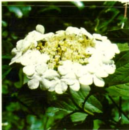
Abb. 2a: Gemeiner Schneeball ( Viburnum opulus ): Trugdolde (wie Dolde) mit vergrößerten (sterilen) Randblüten als Beispiel für „Blume“ als Schauapparat.