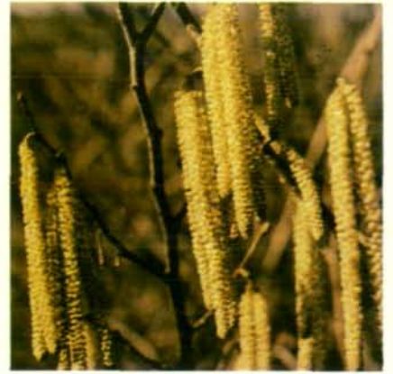
Abb. 3: Hasel: männl. Blüten – gestreckte Kätzchen – entlassen den Blütenstaub; die weiblichen Blüten sind unscheinbar (Knospen mit roten Narbenfäden).

Blumen sind also auf den optischen Sinnesapparat der Insekten abgestimmt. Der Farben- und Formensinn der Blumeninsekten ist daher abgestimmt auf die Blumenfarben. Dies war gar nicht so einfach nachzuweisen. Das überraschendste Ergebnis dieser Untersuchungen war, daß der Farbensinn der Honigbiene (ist bisher am gründlichsten untersucht) nicht mit unserem übereinstimmt. Die Blumen erscheinen den Bienen zwar farbig, aber in Farben, von denen wir keine Vorstellung haben. Richtig müßten wir daher immer von Bienengelb, Bienenultraviolett usw. sprechen, hier seien nur die wesentlichsten Unterschiede aufgezeigt. Die Honigbiene ist, wie alle anderen Wildbienen und die Hummelarten, rotblind, d. h. Gegenstände, die langwelliges Licht (über 600 nm) reflektieren und uns rot erscheinen, haben für die Biene keinen Reizwert und sind für sie schwarz. Dem scheint aber der von den Bie-