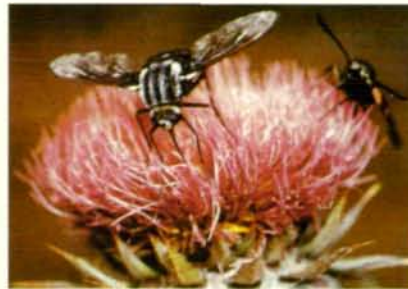
Abb. 14: Der Wollschweber ( Bombylius punctatus ) nektarsaugend an Distel (dünne Röhrenblüten).