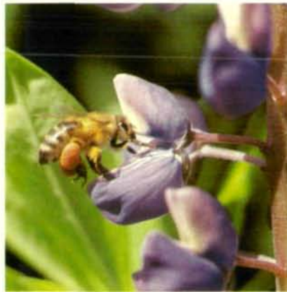
Abb. 12: Honigbiene sammelt Pollen aus Lupinen-Blüte (Pollenblume, nektarlos); beachte die dicken „Höschen“.

Mit dem Verschwinden der blumenreichen „Falterwiesen“ (siehe Titelbild) geht allerdings auch die Mannigfaltigkeit der bestäubenden Insektenarten allmählich verloren, womit das diesbezügliche Anliegen des Naturschutzes an dieser Stelle, im Sinne der Erhaltung der Biotop- und Artenvielfalt, als besonders dringlich hervorzuheben ist.