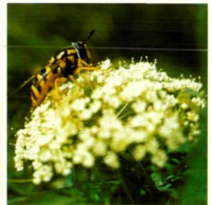
Abb. 15: Die Schwebefliege Xanthogramma sp. an Bibernelle ( Pimpinella sp.).