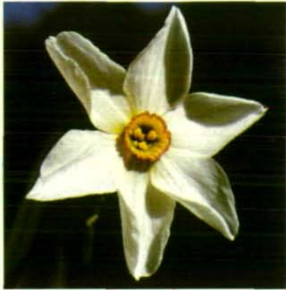
Abb. 1: Narzissenblüte ( Narcissus poeticus ): „Blume als Einzelblüte und gleichzeitig als Beispiel für „Saftmal“. Die uns weiß erscheinende Blüte ist für die Biene blaugrün, der Rand der Nebenkronen, für uns rot erscheinend, ist für die Biene ultraviolett. Das ringförmige Saftmal bildet die Markierung des Blüteneinganges und ist bienenultraviolett.