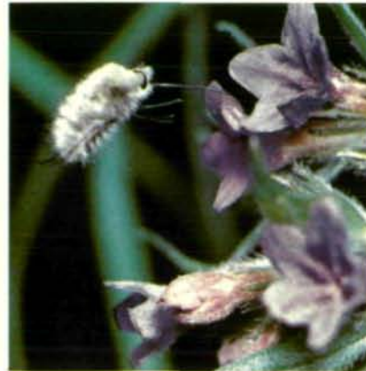
Abb. 13: Der Wollschweber ( Bombylius maior ) im Anflug, kurz vor Landung an Blüte des Steinsamens ( Lithospermum purpureo coeruleum ).