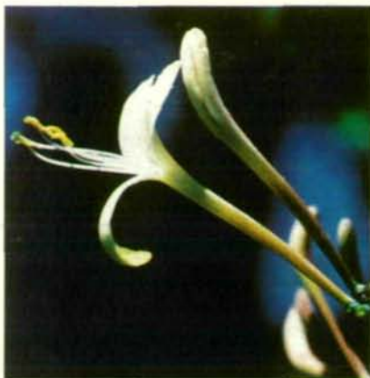
Abb. 6: Geißblattblüte ( Lonicera caprifolium ), eine Schwärmerblüte ohne Sitzgelegenheit, nur für langrüsselige Besucher.