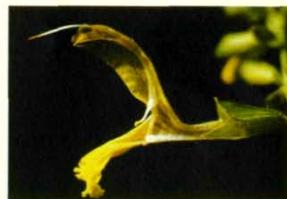
Abb. 10: Klebriger Salbei ( Salvia glutinosa ): halbierte Einzelblüte zeigt „Schlagbaummechanismus“.

Kehren wir zurück zur Bestäubung der Karthäusernelke durch Tagfalter, welche die bevorzugten Bestäuber dieser Nelken sind. Honigbienen