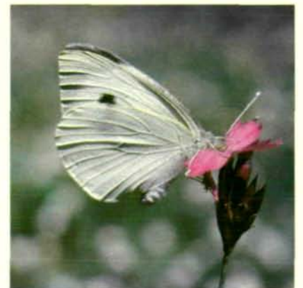
Abb. 5: Ein Kohlweißling ♀ ( Pieris brassicae ) nektarsaugend an Blüte der Karthäusernelke. Beachte, daß der Kopf ganz dicht an die Blüte herangedrückt wird (berühren der Antheren und Narben – Bestäubung!).