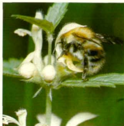
Abb. 8: Eine Gold-Taubnesselblüte ( Laminum galeobdolon ) wird von einer Akerhummel ( Bombus agrorum ) besucht. Ergänze gedanklich Kopf und vorgestreckten Rüssel der Hummel und beachte, daß der Rücken der Hummel Antheren (4) und Narben berührt!

weniger neutralen Hintergrund blaugrüne, strahlende Kreisflecke entgegen. Das Auflösungsvermögen der Bienenaugen ist mehrfach größer als das unserer Augen, so daß der fliegenden Biene die Blumen nicht als unscharfe längliche „Wischer“, sondern als klar umgrenzte, ruhig stehende Objekte erscheinen. Nur die Weißlinge unter den Tagfaltern, z. B. Kohlweißling oder Zitronenfalter, können auch rote Farben sehen, d. h. sie sind rottüchig. Für die blumensu-