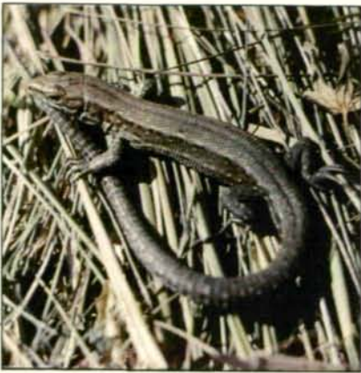
Abb. 1: L. v. pannonica vom Neusiedler See.