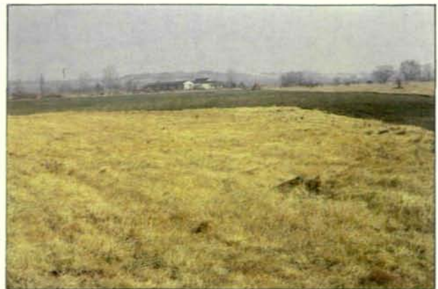
Abb. 3: Fundort von L. v. pannonica am Neusiedler See.

fahrten im Wiener Becken, sah ich auf den Feuchtwiesen stets viel mehr Zauneidechsen ( Lacerta argus LAUR. 1768) und Wiesenottern ( V. u. rakosiensis ) als L. v. pannonica . Zwischen 1938 und etwa 1950 war diese Eidechse noch in der Umgebung folgender Orte zu finden: