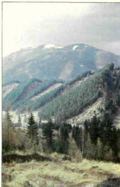
Abb. 5: Fundort von L. v. vivipara im Schneeberggebiet.

Schädlingsbekämpfungsmittel. Dazu kommen noch die sehr häufigen Fasane, die Störche, verschiedene Falken und früher auch vereinzelt Schlingnatter und Wiesenotter. Keine der mir bekannten letzten drei Populationen ist so groß, daß man von einem gesicherten Bestand sprechen könnte. Ich halte es auch nicht für ausgeschlossen, daß die letzten österreichischen L. v. pannonica das Opfer ausländischer Zoologen werden, die oft genug ihre Heimreise in mit Tieren vollgestopften Kleinbussen antreten und, daheim angekommen, unbefangen über Natur- und Artenschutz schreiben oder in Rundfunk und Fernsehen darüber sprechen!