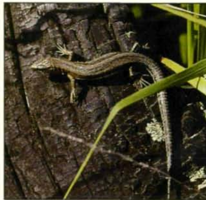
Abb. 4: L. v. vivipara vom Schneeberggebiet.

Überwiegend durch Landkultivierung, Entwässerung, Dünge- und