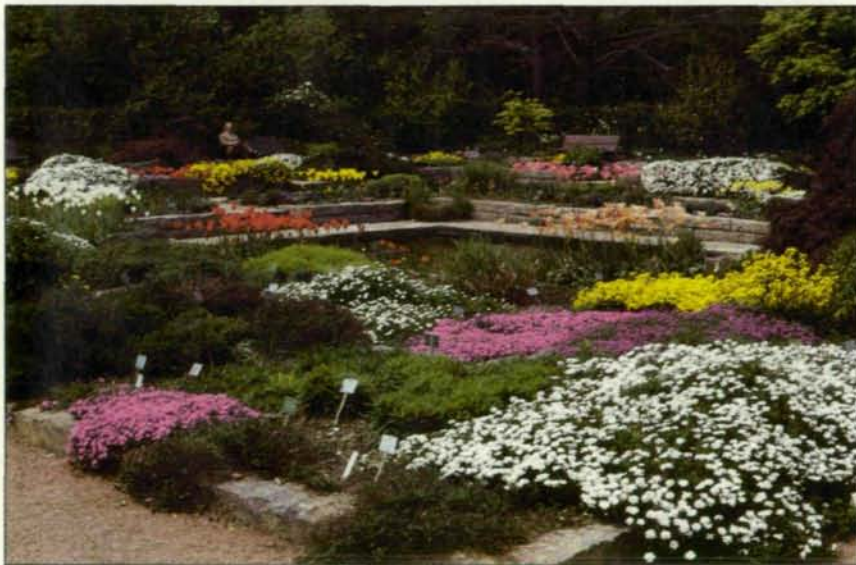
Abb. 3: Auch für das Auge haben Parkanlagen immer etwas zu bieten, wie hier diese Zierblumenanlage im Botanischen Garten der Stadt Linz.