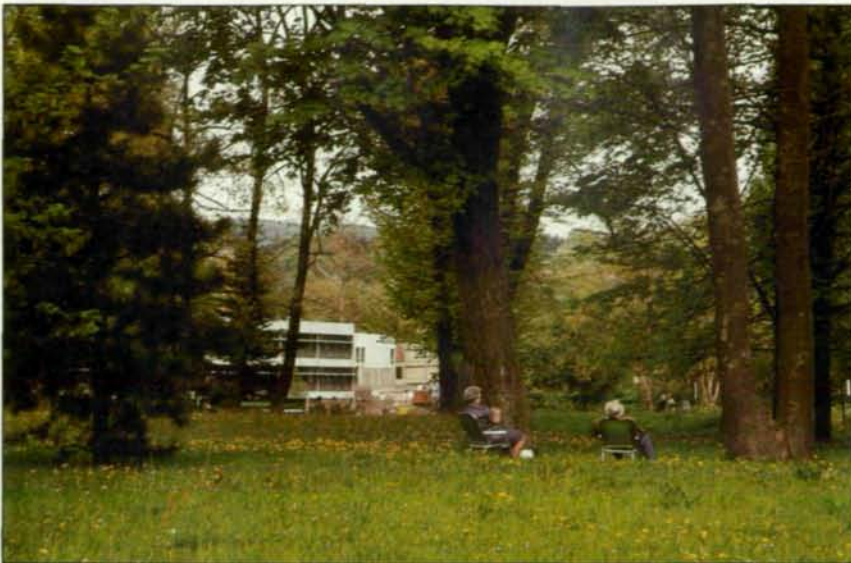
Abb. 2: Parks sind Inseln der Ruhe und Erholung für den Stadtmenschen und haben wichtige klimatische und ökologische Funktionen.