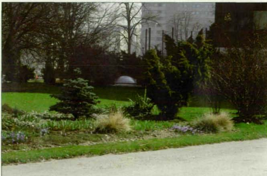
Abb. 4: Zierparks haben in der Stadt zwar durchaus ihre Berechtigung, besitzen aber nicht die ökologische Wertigkeit wie Waldparks.