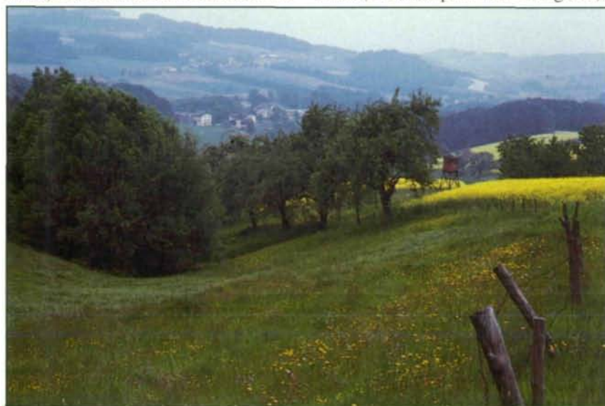
Eine Wiesensenke im Urfahrer Grüngürtel. Der Wiesenanteil ist in den letzten Jahren stark zurückgegangen. Im Rahmen der Landschaftspflegeförderung wird die Erhaltung der Wiesen als extensive Mähwiese gefördert.

* Förderung des Streuobstanbaues : gefördert wird zu 100 % das Pflanzmaterial von hochstämmigen Obstbäumen alter Obstsorten.