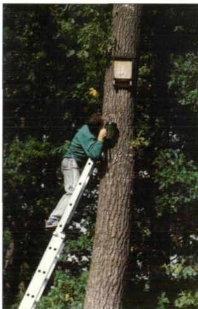
Abb. 3: In Gegenden, wo natürliche Hohlräume in Bäumen fehlen, besteht die Möglichkeit, Fledermauskästen als Ersatzquartiere für baumbewohnende Fledermäuse anzubringen. Die Fledermauskästen werden in einer Höhe von 3 - 7 m am Stamm befestigt. Es ist darauf zu achten, daß der Zuflug zur Einschlußöffnung frei von Ästen ist. Die Kontrolle der Kästen erfolgt über die Einschlußöffnung mit Lampe, wodurch eine Störung der Tiere weitgehend vermieden wird.