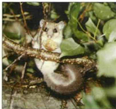
Abb. 4: Die Fledermauskästen werden auch gerne von anderen Tieren (Baumläufer, Haselmäusen, Siebenschläfern und diversen Insekten) bezogen. Eine Wartung der Kästen im Herbst ist daher unbedingt nötig.

B 2: Meisennest - B 3: Meisennest - B 9: Meisennest - B 10: leer - B 11: Meisennest - B 13: Vogelschlafplatz - B 14: leer