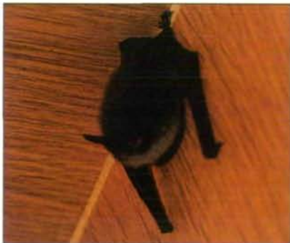
Abb. 2: Kleine Bartfledermaus ( Myotis mystacinus ).

ST 1: leer - ST 2: leer - ST 3: leer - ST 4: leer - ST 5: leer - ST 6: 1 Wasserfledermaus ( Myotis daubentoni ) - ST 7: leer - ST 8: leer - ST 9: leer - ST 10: leer - ST 11: leer - ST 12: leer - ST 13: leer - ST 14: leer - ST 15: leer, Kasten kaputt - ST 16: 1 Kleine Bartfledermaus ( Myotis mystacinus ) - ST 17: Vogelschlafplatz