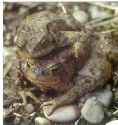
Abb.9: Oft weden die viel kleineren Männchen der Erdkröte vom Weibchen zum Laichgewässer getragen.