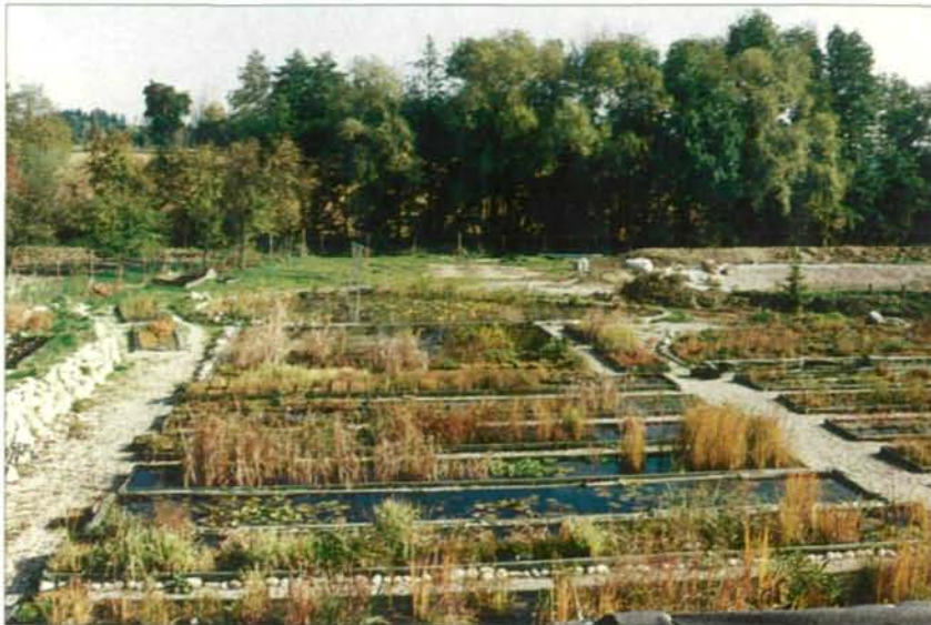
Abb. 3: Die mit Folie ausgekleideten Becken werden mit Regenwasser aus einer Zisterne gespeist; im Hintergrund die prächtig ausgebildete Bachau der Graft.