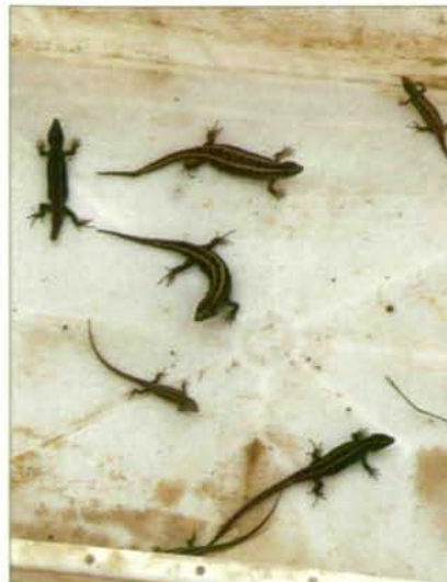
Abb.17: Eidechsen kurz vor der Freilassung. Sie wurden vor dem sicheren Tod durch eine Schubraupe gerettet.