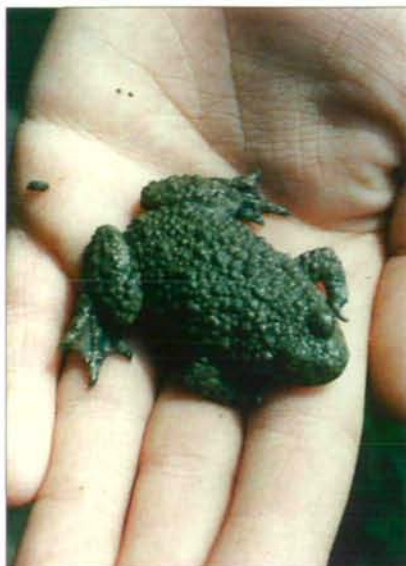
Abb.6: Die Gelbbauchunke wanderte aus den kleinen Tümpeln der Graft zu.

Unter Pfosten und alten Steinplatten am Rande des Gärtnerengeländes fand ich am 1. Mai mehrere Blindschleichen ( Anguis fragilis - Abb. 15); 3 Tiere maßen 24 - 27 cm, 4 Exemplare über 40 cm. Auffallend war bei einem Exemplar eine stärkere Blaufärbung