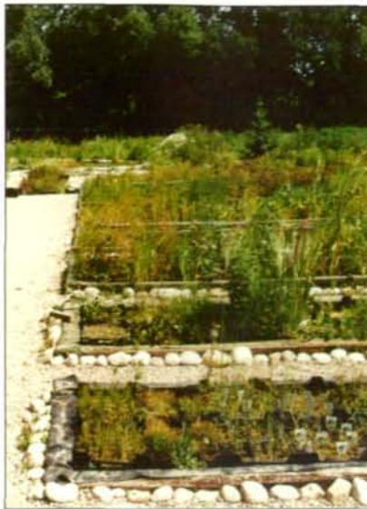
Abb.14: Runde Steine am Beckenrand dienen als Verstecke für abwandernde Jungfrösche und sollen auch Kröten den Zugang zum Wasser erleichtern.

Am 16. März wurden die ersten Grasfrösche gesichtet - 9 Exemplare, davon vier in der Gärtnerei im 30 cm tiefen Teich. Leider wurden auch 2 tote Tiere aus einem Becken mit 15 cm Wassertiefe geborgen. Rätselhaft ist, ob die Tiere dort überwintern wollten. Am 26. März fanden wir die ersten Laichklumpen, 5 in den Wasser-