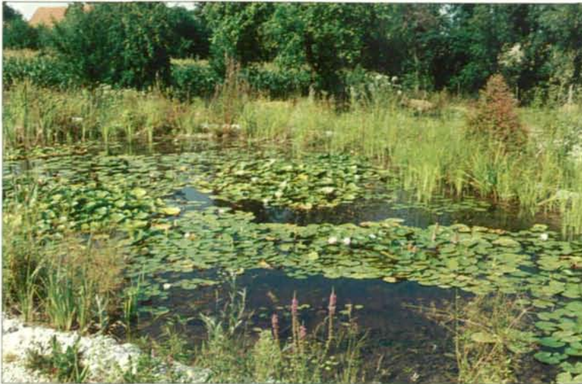
Abb. 11: Innerhalb von 2 Jahren ist dieser Teich fast zugewachsen und bildet daher einen idealen Lebensraum für die Kammolche.