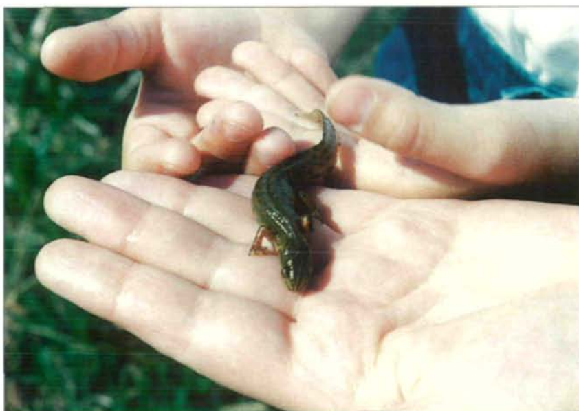
Abb.10: Unter den drei Molcharten (Kamm- und Bergmolch) dominiert bei weiten der Streifenmolch; siehe dazu die typischen Larven (Abb. 28).