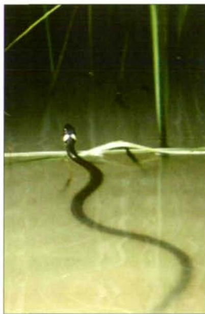
Abb.22: Nach dem Aufbau der Amphibienpopulation stellte sich bald die Ringelnatter ein.

Leider mußte die „Hauslacke“ wegen des Kanalbaues kurzfristig zerstört werden. 9 Laichballen und 6 Grasfrösche, 1 Bergmolchmännchen und 11 Gelbbauchunken wurden vorsichtig aus dem Baggerbereich („Graft“ und „Hauslacke“) in die Gärtnerei in die kleinen Teiche und Becken übersiedelt.