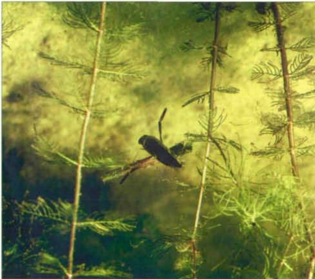
Abb.25: Notonecta glauca - Rückenschwimmer zwischen Myriophyllum .