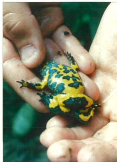
Abb.7: Die schwarzgelbe Bauchseite signalisiert Feinden „Ungenießbarkeit“ (Totstellreflex).