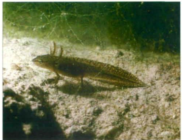
Abb.28: Molchlarven sind sehr leicht an den äußeren Kiemenbüscheln zu erkennen.