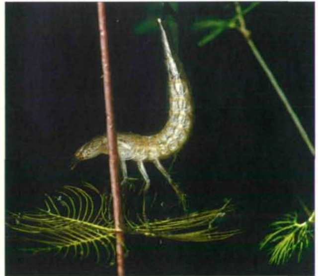
Abb.24: Gelbrandkäferlarve auf Myriophyllum , eine räuberische Larve, die gerne Kaulquappen erbeutet.