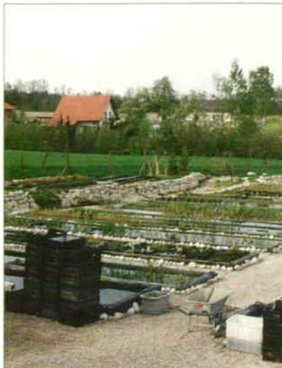
Abb. 16: Fast alle Pflanzbecken sind Lebensräume verschiedener Lurche. Links die 40 m lange Trockenmauer aus Konglomeratsteinen.

Wie im letzten Jahr waren im Juli und August viele junge Grasfrösche und Gelbbauchunken zu finden, deren Anzahl sich niemals genau feststellen ließ.