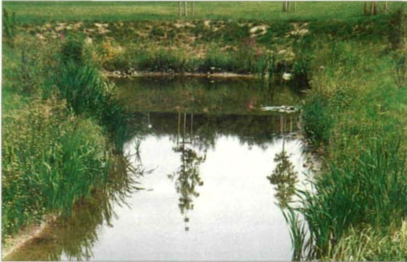
Abb.4: Der Wasserspiegel des 25 m langen, 5 - 8 m breiten Überlaufbeckens schwankt beträchtlich; u.a. siedelten sich Iris, Rohrkolben und Gelbbauchunken an.