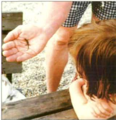
Abb. 30: Staunender Blick auf eine junge Zauneidechse, die wir mit unserer Hand schützen oder vernichten können.

Wir lehnen jedoch strikt Importe von Pflanzen, z.B. Seerosen ( Nymphaea alba ) aus Ungarn ab, die dort der Natur entnommen oder auch gezüchtet werden, ebenso den Import von