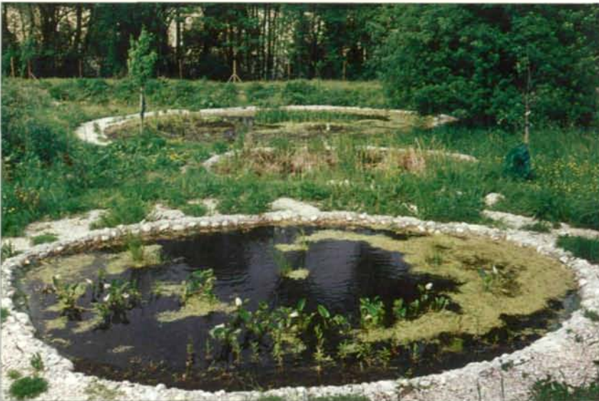
Abb. 12: Der Rand der kleinen Teiche wurde mit Magerbeton und Steinen befestigt; der Wasserspiegel schwankt um 10 cm.