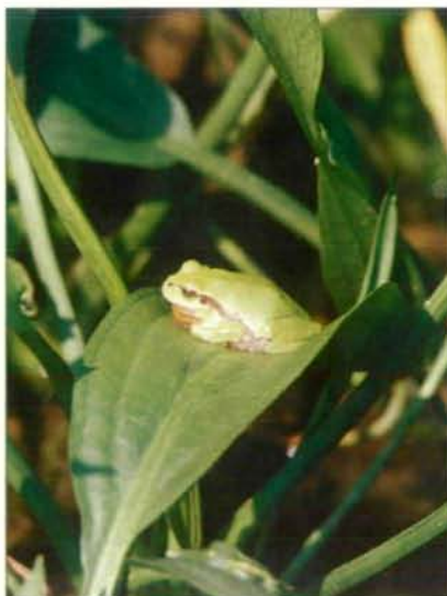
Abb.20: Tagsüber saßen die Laubfrösche oft auf Froschlöffelblättern und rückten immer der Sonne nach.