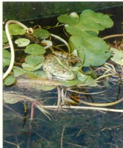
Abb.19: Prächtiger Wasserfrosch sonnend auf den Blättern der Seekanne in einem Becken.