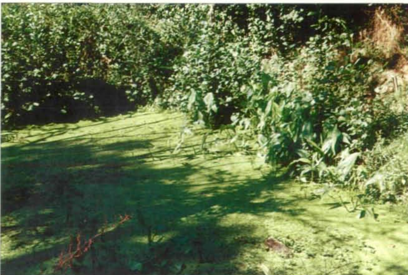
Abb.5: Die Wasseroberfläche der „Hauslacke“ ist von Lemna bedeckt; prächtige breitblättrige Sagittaria - von mir eingesetzt - gedeiht am Ufer.

ernhäuschen mit einer „Hauslacke“ (25 m 2 Oberfläche, 70 cm tief), welches ich 1991 erwerben konnte (Abb. 5).