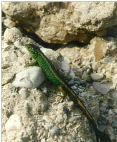
Abb.18: Männchen der Zauneidechse; um 10 Uhr Vormittag begann meist das „Sonnenbad“.