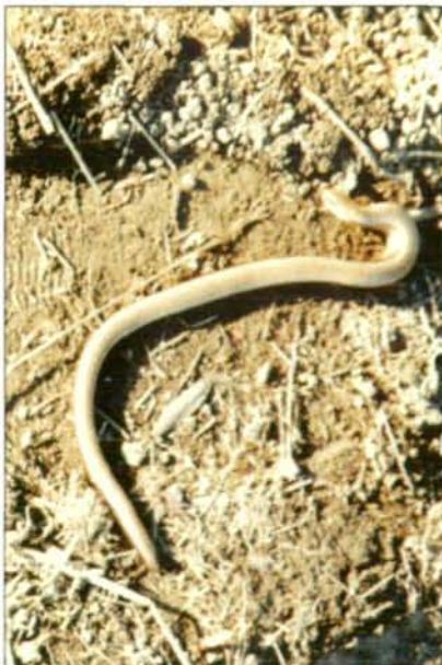
Abb.15: Blindschleichen sind überall im Gelände anzutreffen, auch unter den ausgelegten Folien.

Ein außergewöhnlich großes Weibchen, umklammert von einem wesentlich kleineren Männchen; die Laichschnüre waren in einer Tiefe von 10 - 30 cm zwischen Pflanzen einige Tage später zu sehen. Das Weibchen fanden wir im Sommer mehrmals an einem kühlen Platz unter drei Baumstämmen, die wir aus diesem Grund nicht wegräumten.