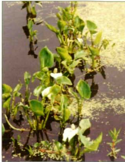
Abb. 29: Die Sumpfcalla ist in der Natur äußerst selten geworden.

Die Problematik der Flora- und Faunaverfälschung durch den Sumpf- und Wasserpflanzenverkauf ist uns bewußt, wir sind jedoch der Überzeugung, daß der Nutzen der Ansiedlung zum Teil ausgestorbener Pflanzen und Tiere in Biotopen und Schwimmteichen größer ist, als der Schaden, der entsteht. Durch den Verkauf von Tauchpflanzen gelangen unbeabsichtigt die Gelege der verschiedenen Molcharten in Teiche, oft bilden sich bleibende Populationen. Eine diesbezügliche Studie haben wir in Arbeit. Es handelt sich jedoch immer um Schwanzlurche aus Oberösterreich, da wir keine submersen Pflanzen aus anderen Gebieten beziehen.