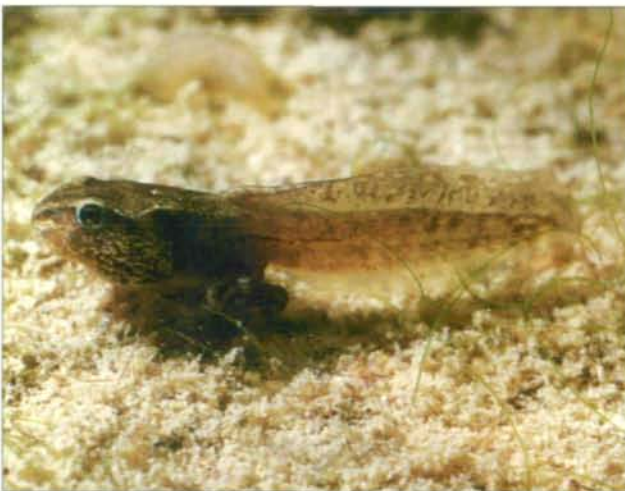
Abb.27: Kaulquappe mit bereits ausgebildeten Hinterbeinen - der Schwanz bildet sich im Verlauf der weiteren Entwicklung zurück.