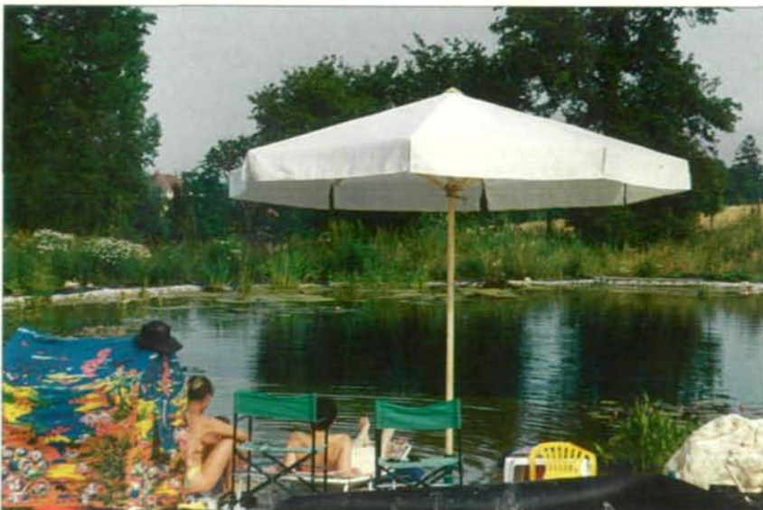
Abb. 13: Mensch und Tier vertragen sich gut in diesem Schwimmteich: Homo sapiens , Natrix natrix , Triturus cristatus , Rana temporaria , Hyla arborea ...

im Kopfbereich. Durch Auflegen weiterer Steinplatten und Aufschichten von Ästen mit Laub vermisch, versuchten wir fortan weitere Lebensräume für diese Tiere zu schaffen.