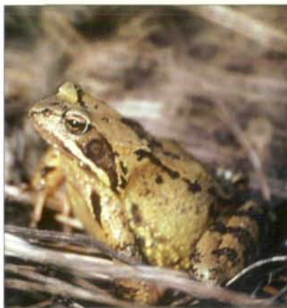
Abb.8: Der Grasfrosch stellte sich als eine der ersten Amphibienarten ein.