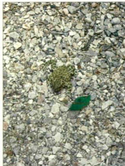
Abb.21: Wechselkröte, die wegen ihrer Tarnfarbe kaum auf dem Kiesweg erkennbar war.