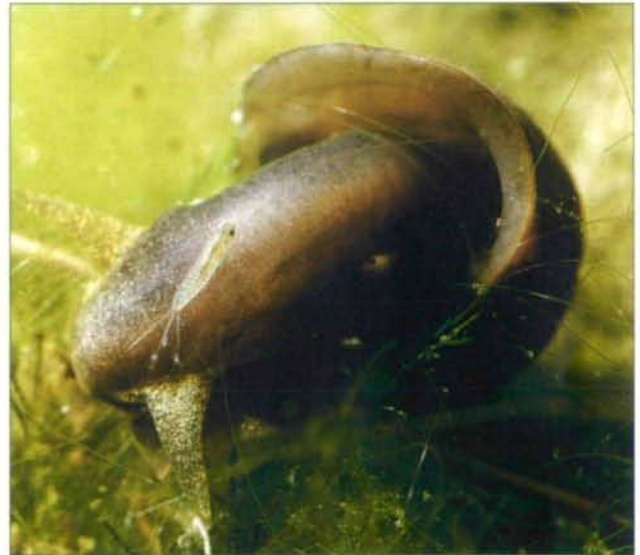
Abb.26: Schlamm Schnecke bei der Nahrungsaufnahme; im Vordergrund Eintagsfliegenlarve.