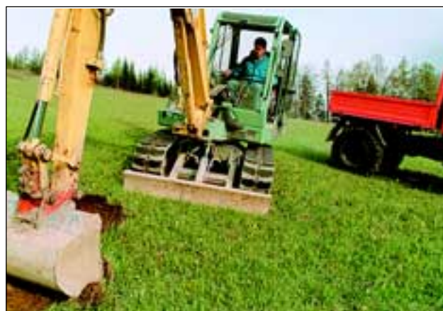
Abb. 16: Vorsichtiges Abtragen des Kalkmagerrasens in ca. 60 x 80 cm großen, 10-15 cm dicken Wiesenstücken, mit dem Kleinbagger und Verladen auf den Unimog, welcher an diesem Tag 35 Fuhren zur Ersatzfläche brachte.