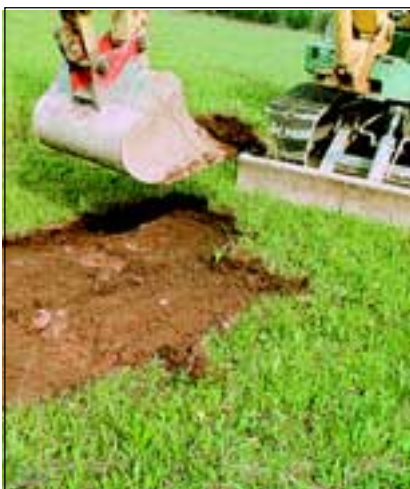
Abb. 20: Auch auf der Himmelreichwiese war die Humusschicht nur 10-15 cm dick.