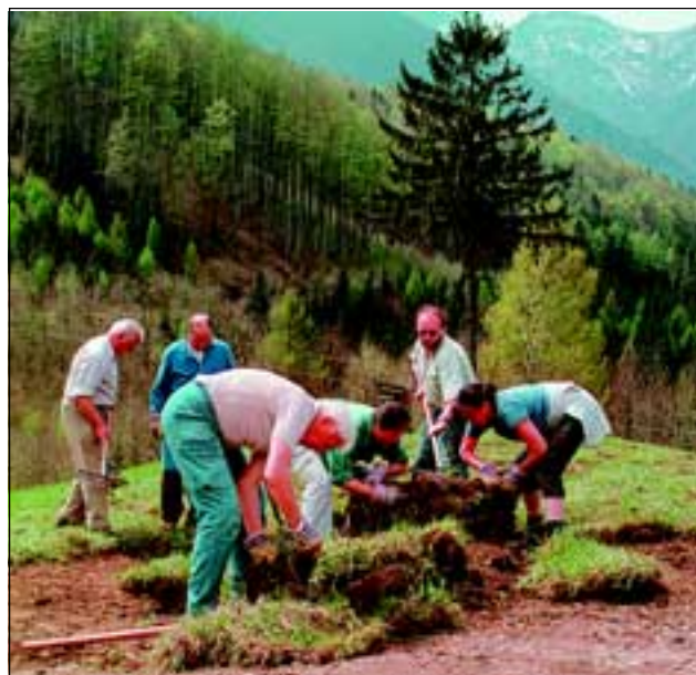
Abb. 18: Die Rasenteile wurden in Kraft raubender Handarbeit zurechtgerückt und aneinander gefügt.

Mit dem Kleinbagger wurden Rasenstücke mit den Maßen von etwa 60 x 80 cm und einer Dicke von 10-15 cm abgetragen - dicker war die Humusschicht nicht - vorsichtig auf den Unimog verfrachtet (Abb. 16) und über teilweise ziemlich unwegsames und steiles Gelände zum Bestimmungsort transportiert. Dort angekommen, wurden die Rasenflächen in Kraft raubender Handarbeit zurechtgerückt und aneinander gefügt (Abb. 17-20). Dabei mussten die immer wieder anfallenden Zwischenräume mit Kleinstücken und Humus aufgefüllt werden, um das Austrocknen von den Rändern her zu verhindern.