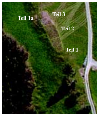
Abb. 22: Lage der neu aufgetragenen Teilstücke am 29. April 2001.