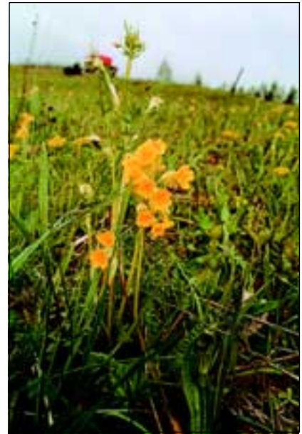
Abb. 7: Zu hunderten steht die Frühlings-Schlüsselblume ( Primula veris ) noch auf der Himmelreichwiese.

Frühlings-Enzian ( Gentiana verna ), Frühlings-Schlüsselblume ( Primula veris - Abb. 7), Geflecktes Knabenkraut ( Dactylorhiza fuchsii ), Arnika ( Arnica montana ), Schwarzwiolette Akelei ( Aquilegia atrata ), Kartäuser-Nelke ( Dianthus carthusianorum ), Schopfige Kreuzblume ( Polygala comosa - Abb. 8), Weiße Waldhyazinthe ( Platanthera bifolia ), Ästige Graslinie ( Anthericum ramosum ), und anderen Kalkmagerrasen. Dieses Wiesenareal von dem hier die Rede ist, stellt den Rest der so genann-