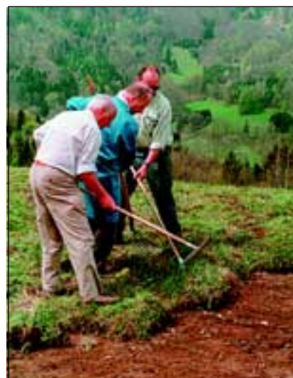
Abb. 19: Der Einsatz von Rechen zum Ziehen hat sich beim Aneinanderfügen der Rasenziegel bestens bewährt.