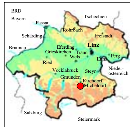
Abb. 1: Lage des Michelberges/Micheldorf in Oberösterreich.

seinen unzähligen, bereits sehr seltenen, unter Naturschutz stehenden Pflanzen zu retten.