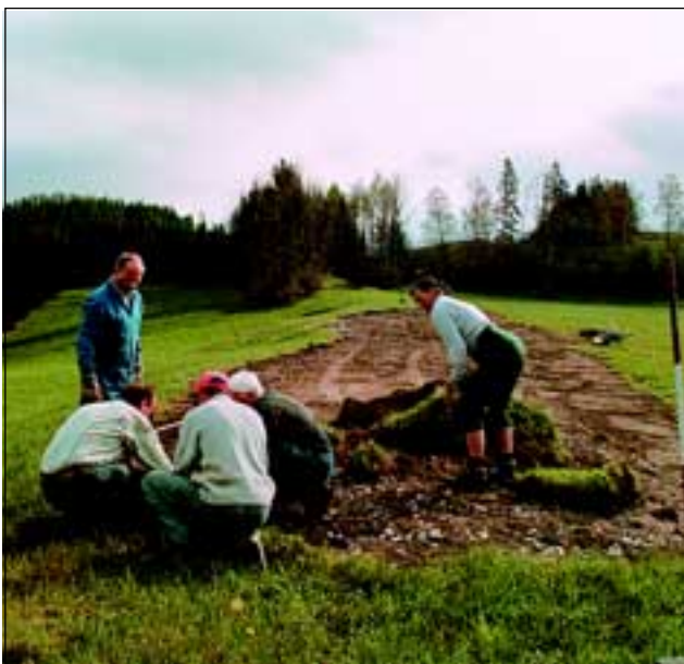
Abb. 17: Bei den ersten Rasenstücken war noch öfter zu überlegen, wie sie am besten aneinanderzufügen seien.