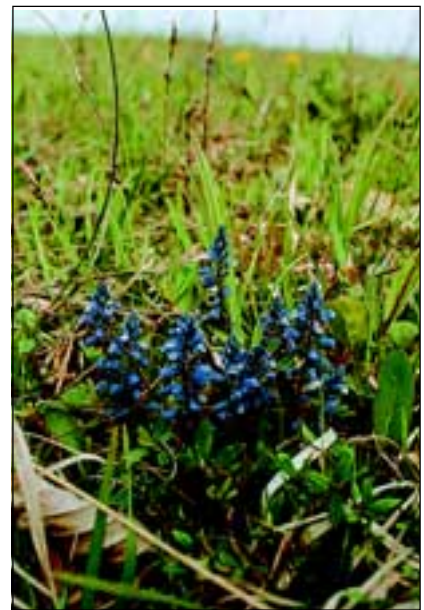
Abb. 8: Die Schopfige Kreuzblume ( Polygala comosa ) kommt in mehreren Farbvarianten vor: von blau bis weiß.